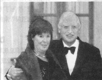
费尔霍伊根和他的妻子