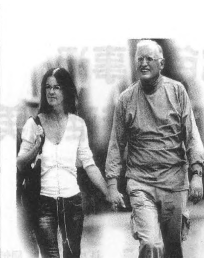
费尔霍伊根和情人

2007年6月1日，德国社会民主党议员汉斯·朱根·乌尔承认自己担任大众汽车公司工会代表期间，曾经接受过大众汽车公司前官员安排的“性贿赂”，和多名妓女参加性爱派对，大玩性游戏。据悉，乌尔此前曾5次向法庭宣誓，否认自己接受过大众汽车公司的任何“性贿赂”，但当至少6名妓女表示愿意作证后，这名丑闻缠身的议员终于承认自己撒了谎，并且被迫辞去了议员职位。检查