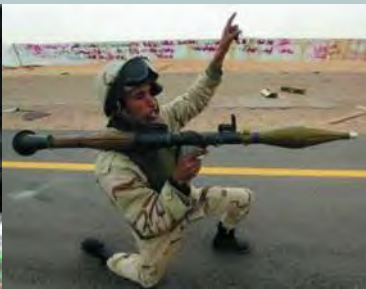
RPG 火箭筒在这场大战中自然也不会少。不过从很多新闻照片和录像上看，反对派操作它的水平显然还不高