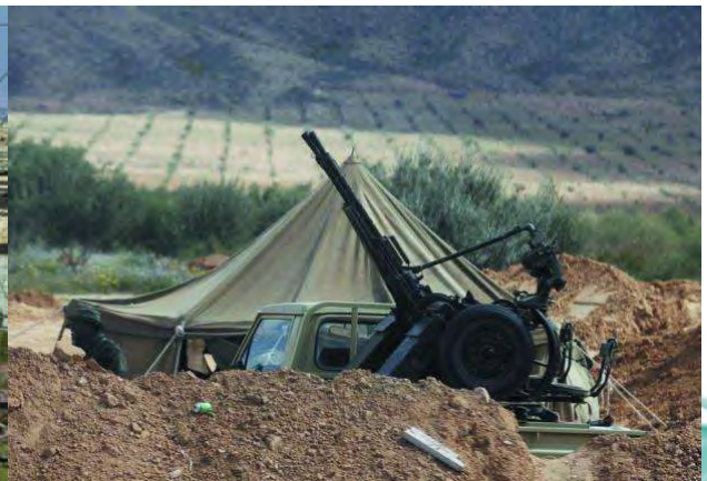
面对北约空军那些根本不在一个档次的先进战斗机，利比亚政府军只能靠这些KPV高射机枪和23毫米高炮壮胆