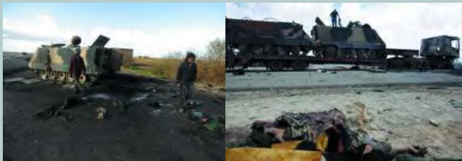
被空袭击毁的 M113 装甲车。在北约强大的空中优势面前，利比亚政府军的很多装甲力量甚至没有机会进入战斗状态