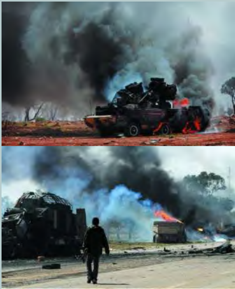
被击毁的SA-8地空导弹发射车。这在利比亚军队中算是很好的防空武器了。但和现在的北约空军比起来，它们基本上没有射击的机会。而且要想支撑自行防空导弹、坦克等机械化装备作战，必须有足够的后勤运输保障能力。北约空军对利比亚政府军车队的空袭，是让他们功败垂成的主要原因