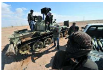
利比亚反对派从坦克里收集弹药

利比亚反对派从政府军那里缴获了不少坦克。左边这辆负重轮数量,以及车首的防浪板上很容易看出是辆T-72主战坦克。上边这辆还是线膛炮,显然是T-54/55系列的。这也是利比亚陆军装备量最大的坦克。右边这辆的车体与T-54/55相似,但炮口里没有膛线,抽烟装置离炮口较远,因此是一辆T-62