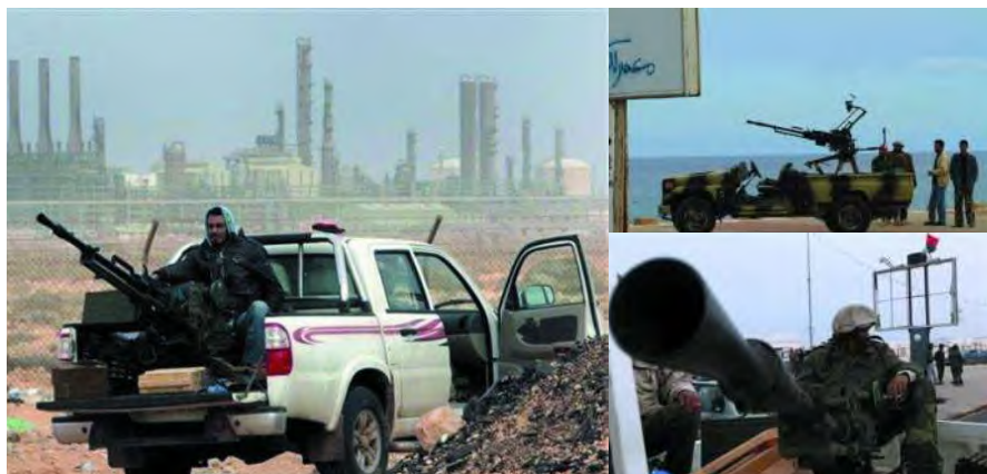
KPV型14.5毫米高射机枪是苏联在50年代设计的一款大口径机枪,而且有单管、双管、四联装等多种样式(参见封底),曾大量出口到世界各地。利比亚军队根据自己的地理环境和车辆条件,曾把KPV大量安装到皮卡车上,防空近战两相宜。现在反对派也如法炮制,成为其最重要的支援火力