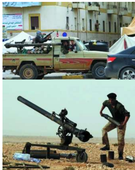
美国M40式106毫米无坐力炮,炮管上的一挺试射机枪是它的典型特征。利比亚反对派把它装到皮卡车上使用,这还算是好办法,因为美军也曾把M40配备到吉普车上。可是把这么一种直瞄火炮当作榴弹炮用,进行间接射击,那准头可就……也许就是为了给您拍照的

菲还有能翻盘的“撒手锏”吗?对于卡扎菲是否掌握大规模杀伤性武器的问题,外界一直颇多猜测。历史上,卡扎菲确实有拥有化学武器的记录和发展核武器的计划,利比亚一直在美国防扩散的名单之上。在上世纪80年代与乍得的“丰田战争”(因大量使用丰田牌皮卡得名)期间,利比亚就有使用芥子气等化学武器的记录。2003年,国际核查人员吃惊地发现,利比亚竟然拥有4000多台离心机,其产出的浓缩铀数年后便可达到制造核弹的水平。2003年9月,卡扎菲宣布放弃所有核生化武器以及射程超过300千米的陆地导弹,签署《不扩散核武器条约》附加议定书,加入《禁止化学武器公约》,并接受监督核查。美国对此当然表示欢迎,但并没有放弃对利比亚的监控与武器禁运。卡扎菲虽然主动放弃了大规模杀伤性武器这张“威慑底牌”,但据说在其老家锡尔特仍存储了10吨芥子气。