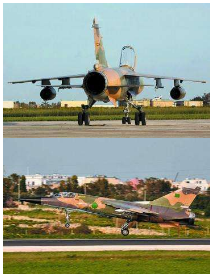
利比亚空军除了苏式战斗机，还有不少法制战斗机。现在面对自己的“师父”，自然有一些飞行员思想动摇。在北约军事介入前，就曾有两名飞行员驾驶“幻影”F1 战斗机逃到马耳他