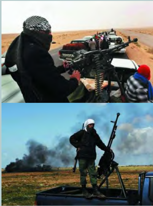
苏制DShKM型12.7毫米机枪。该枪在苏式装甲车辆上很常见，圆形的枪口制退器是其典型特征

封锁。利比亚90%以上的领土都是一马平川的沙漠地带，坦克、装甲车和火炮等重型武器装备难以藏身，在空中打击面前处于无处可逃的被动挨打境地。利比亚与欧洲距离较近，相隔地中海与许多北约国家的军事基地隔海相望。法国南部科西嘉岛的空军基地距离利比亚只有1小时左右的航程。美、英、法等国的海空军在地中海展开部署后，非常方便实施远程奔袭和精确打击，总体上形成了对利比亚的大军压境之势。