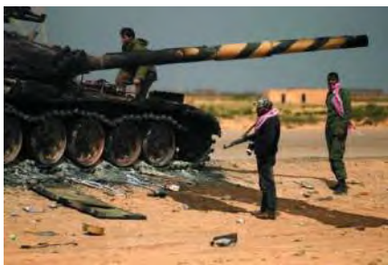
被击毁的利比亚政府军 T-72 坦克。从毁伤情况看，它们并非死于反对派的火箭筒，而是英法战斗机帮的忙

利比亚空军实力衰退严重，防空能力薄弱，难以抵挡联合空中打击。对于弱小国家实施“非对称作战”而言，防空能力十分重要，直接关系到战争胜败。20 世纪 80 年代以来，由于国际制裁及屡遭美国