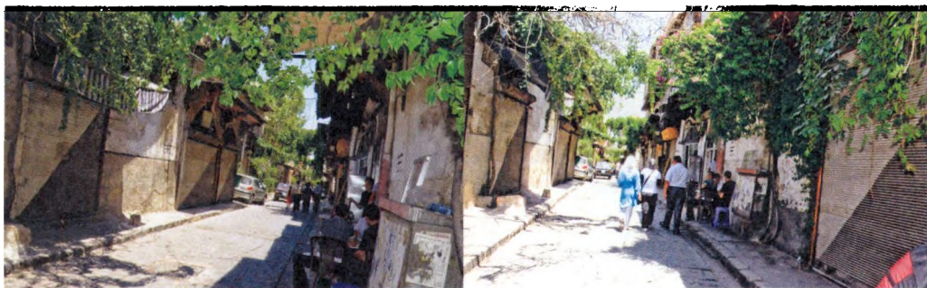
图11 大马士革老城街道

今、万世流芳的遗址遗迹，让人类在此找到了自己的历史，也再次认识了自己。后人来到它们面前，应当有敬畏感，只能将这些历史遗产的典型性、原真性保留下来，再传之后世。被称为“伊朗的第一历史名城”——波斯波利斯，已有2500多年历史。古代波斯帝国三代国王，历时五十多年建设，始具规模，宫殿群占地14万平方米，成为地跨亚非欧三大洲的波斯帝国的象征。公元前330年打败波斯的马其顿国王亚历山大焚毁波斯波利斯，剩下的断壁残垣和台基遗迹，湮灭在黄沙之中。1633年首次被人发现，1930年代美国芝加哥大学东方研究所和伊朗王国政府联合对建筑群遗址开展了最初的保护工作。持续八十年的考古发掘，揭示了古城的全貌。整座王宫建筑群都是由高大的石墙和石柱组成，上面有精美的雕刻。高达18米的万国之门，由100根高11.3米的石柱构成的百柱厅，面积达8000平方米迷宫式的珍宝库……，置身于这一座座废墟前，令人油然而生的感叹词是“壮美”！当代伊朗人只在珍宝库区偏僻角落修复了一座750平方米的平房，用作陈列出土文物的展厅。埃及努比亚的神庙，底比斯的古城，约旦佩特拉古城，叙利亚