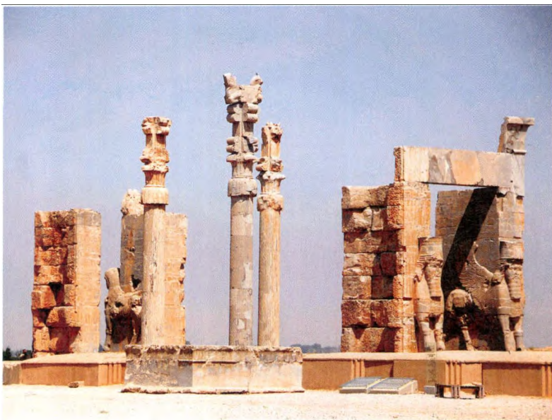
图6 波斯波利斯遗址 万园之门

1972年11月联合国教科文组织第17届大会通过了《保护世界文化和自然遗产公约》，即《世界遗产公约》。这个公约是在全球范围内具有深远影响的国际准则性文件。其主要作用是确定世界范围内的文化与自然遗产，将那些被认为具有突出普遍价值的古迹和自然景观公布出来，让全人类承担起保护的责任。世界遗产分三类：文化遗产、自然遗产、文化与自然双重遗产。文化遗产包括文物、建筑群、遗址。1976年世界遗产委员会成立，并建立《世界遗产名录》，受理审议世界遗产申请。中东四国闻风而动，很快加入公约成为缔约国并申报本国重要的历史遗址。早在1979年，埃及