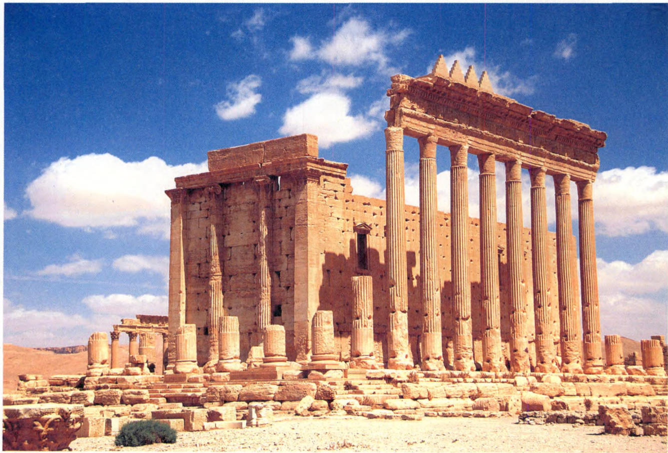
图1 叙利亚巴尔米拉遗址