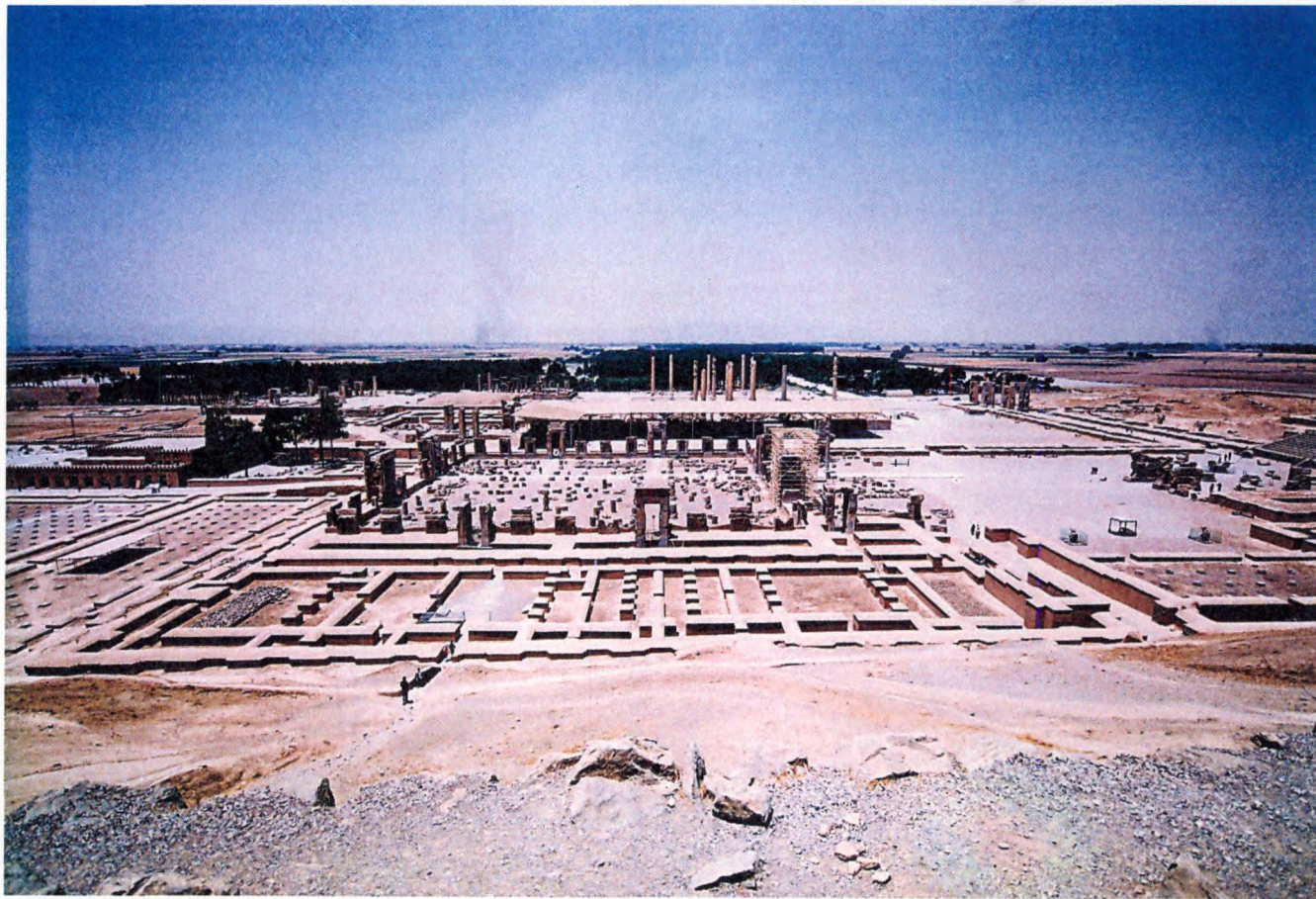
图5 波斯波利斯遗址

1920年成为叙利亚（法国委任统治地）的首府。1946年叙利亚独立以后，定为首都。