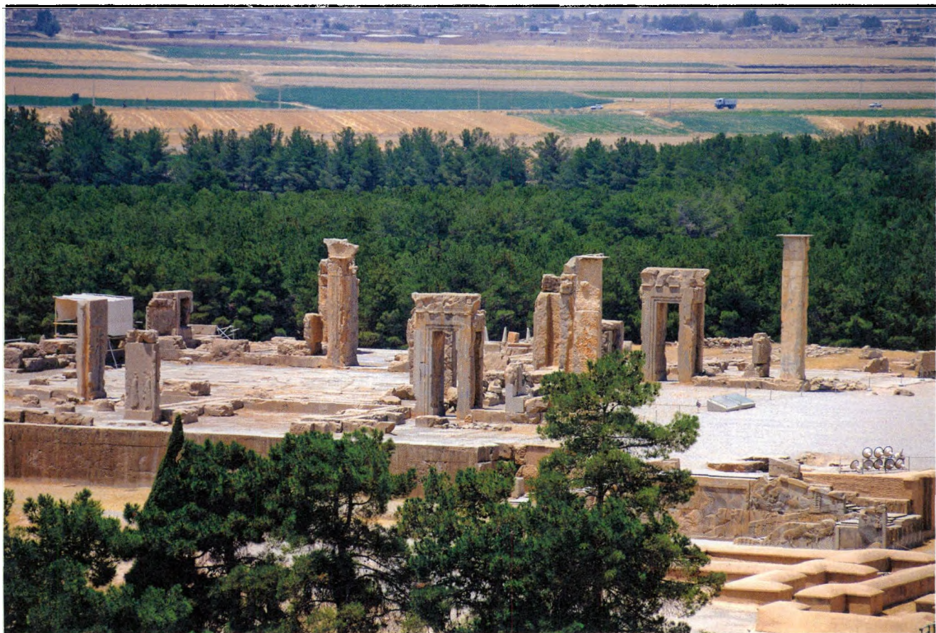
图8 伊朗波斯波利斯

施工中，工程人员偶然发现一处地下墓穴——帕尔米拉古城便在人们毫无准备的情况，砰然打开了深邃的大门。值得庆幸的是，古城的发掘、保护与开放，看得出来，都是由有丰富经验的专家学者精心操作，没有急功近利的浮躁。否则，我们今天见到的古城或许就是另外一番景象。