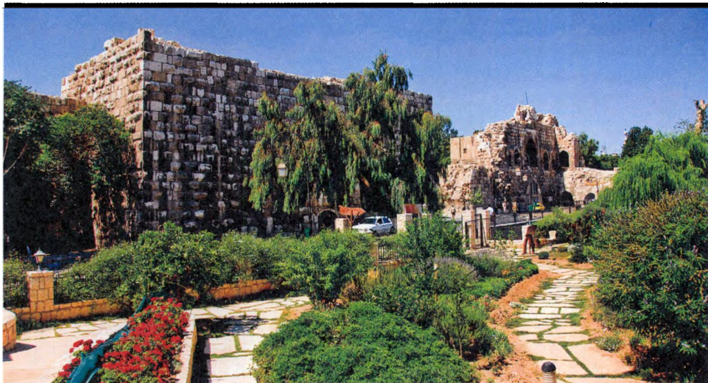
图10 大马士革古城墙