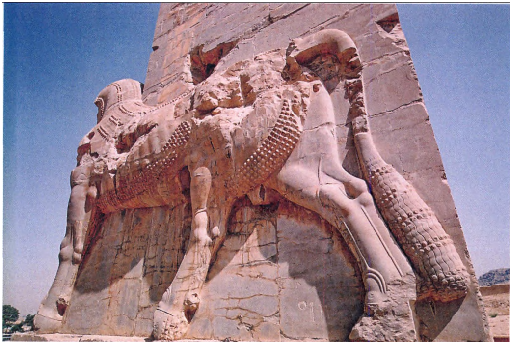
图9 伊朗波斯波利斯古迹