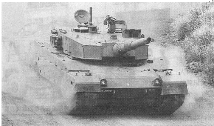
阿曼军队装备的日本90式坦克