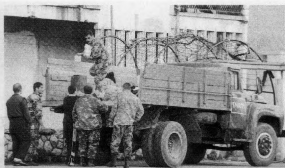
叙利亚共和国卫队是唯一一支被允许部署在首都的武装力量

叙利亚共和国卫队又称总统卫队，拥有大约1万多人，主要部署在叙利亚首都大马士革附近。同时，共和国卫队也是唯一一支被允许部署在首都的叙利亚武装力量，因此，这支部队的任务非常明确：保卫叙利亚总统及该国高级官员、维持首都大马士革的治