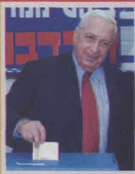
沙龙当选总理时的照片