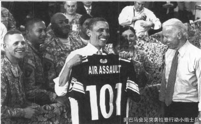
奥巴马会见突袭拉登行动小组士兵