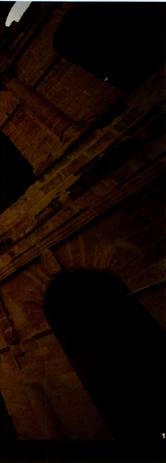
1. 艾尔·杰姆斗兽场的围墙十分高大，据称是北京故宫城墙的五倍。 2. 突尼斯人热情且友好，在他们眼中，大部分中国人都会武功。