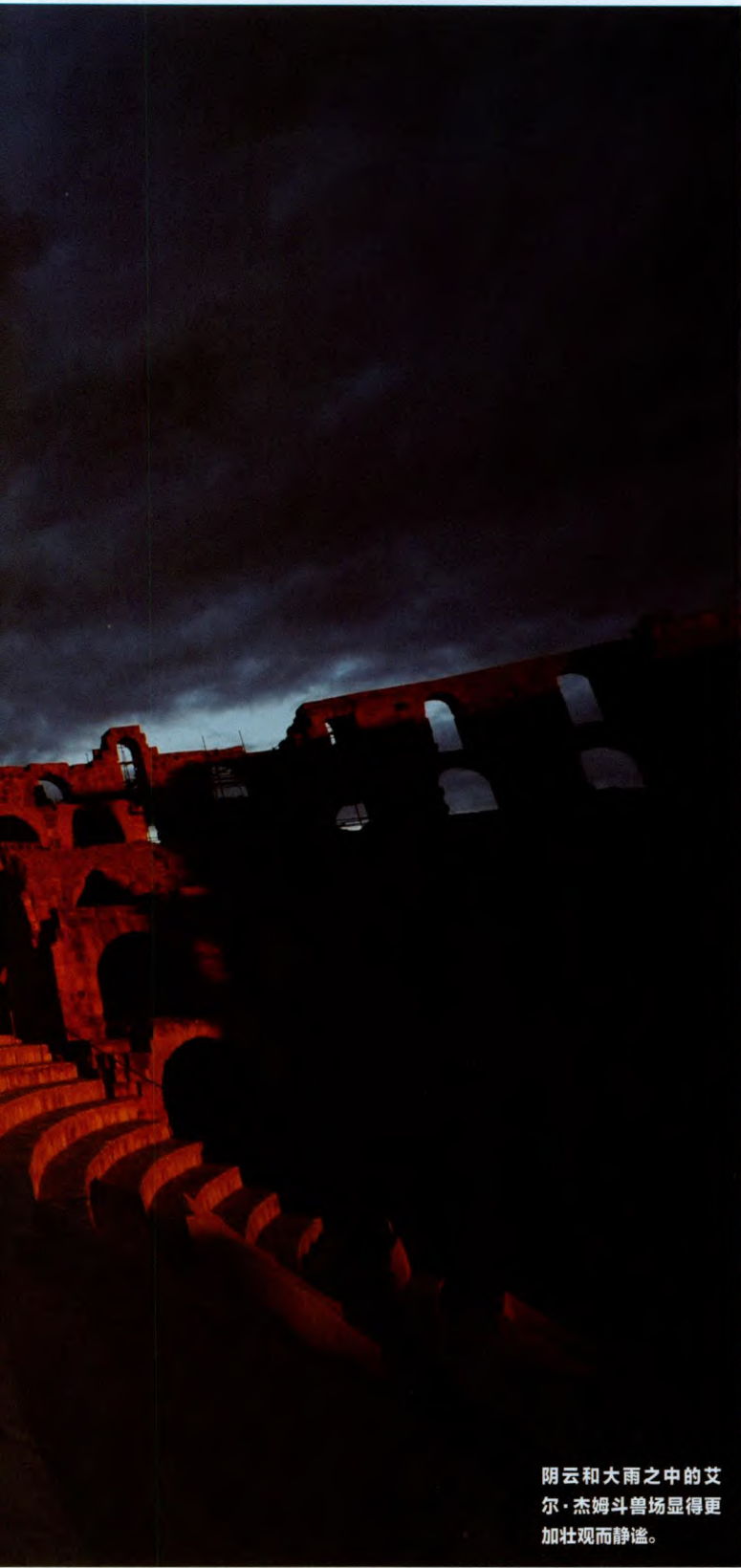
阴云和大雨之中的 艾尔·杰姆斗兽场显得更加 壮观而静谧。