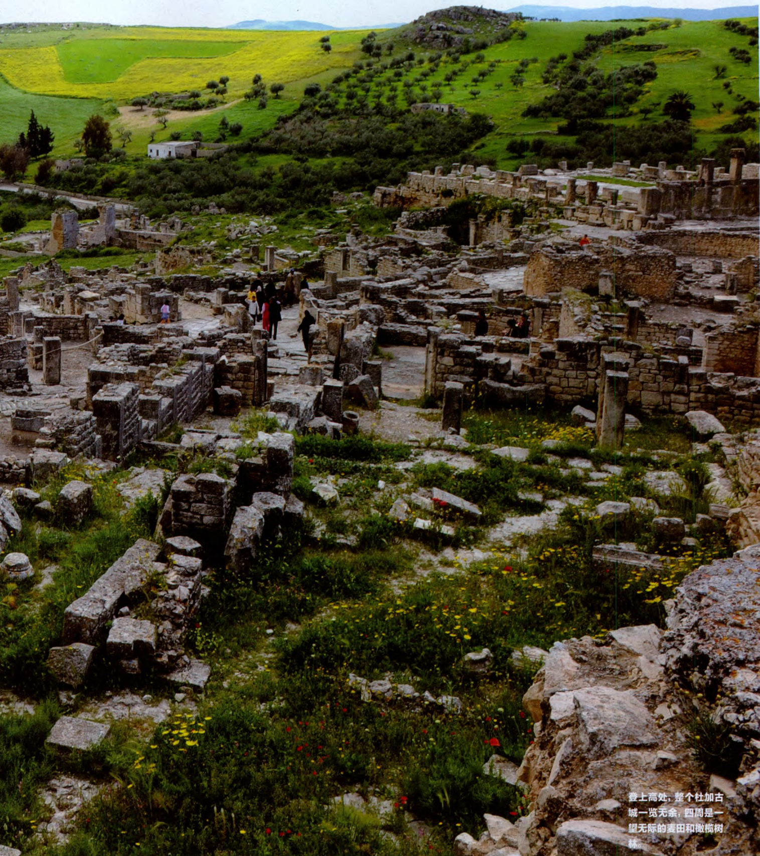
登上高处，整个杜加古城一览无余，四周是一望无际的麦田和橄榄树林。

隐约看出两边对称的一间间浴室。主体建筑物为长方形，完全对称，纵轴线上是热水厅、温水厅和冷水厅。而曾经的八根巨大的柱子，只孤零零地矗立着一根15米高的，而且看起来还像是后人重新堆砌立起的。