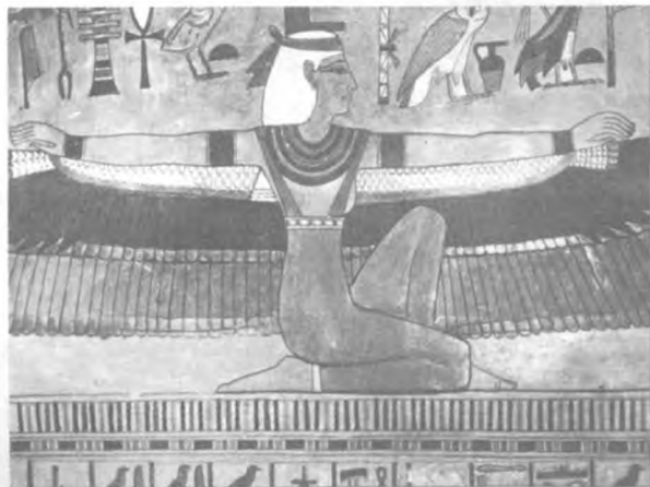
伊西斯女神是地位最高的魔法师

不寻常。但从纸卷上看来，在古代，魔法师经常是埃及神话中的英雄，他们驱除病魔，创造奇迹。不论是法老还是平民，每一个信仰埃及神祇的人一生中都需要依赖某些魔法的帮助，都有可能获得魔法的力量，因为神是最伟大的魔法