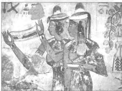
魔书招来了女子亡魂的引诱

在独自一人驾船回孟斐斯的途中，这位陷入痛苦和绝望中的王子深深地感到后悔。“如今我如何能独自生活下去，如何告诉我父亲发生的一切？”他沉吟不已。在抑制不住的悲伤中，他把《透特之书》紧紧地系在身上，纵身跳入河中。直到他的船到达孟斐斯，人们才发现他，原来他的尸体被方向舵缠住了。痛失爱子的法老敬畏神的力量，也不愿这本致命的书继续流传于世，便将他连同儿子的尸体永远埋在地下。