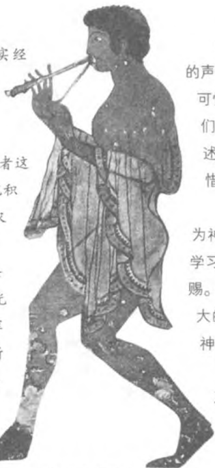
沙漠里冒险的旅行者

“赫卡”意为“嘴巴的艺术”，具体表现为咒语和符咒。通常，书面的文字会被人们认为更具有法力，因而埃及最伟大的魔法师群体是读经僧侣，他们负责编写神庙里的莎草纸书卷。有一些读经僧侣会作为法老的宫廷顾问和外交使者为法老服务，但更多时候，他们受聘于附属神庙的教育机构——生命之屋。那是专门修建用于保存大量宗教资料的图书馆，读经僧侣们在那里研究书卷中的秘密，得到神秘的魔法。