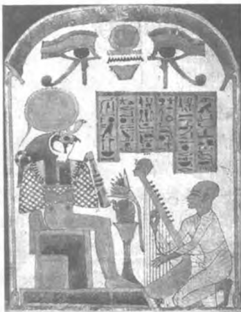
太阳神瑞会对随意动用魔法之书的人降下惩罚

然而那条蛇非比寻常，两段蛇身蠕动着，很快接合在一起恢复原样。王子一次次向蛇挥动利斧，但被砍断的蛇身一次又一次地愈合在一起。最后，王子趁砍断的蛇身尚未愈合之际，抓起一把沙土撒到蛇的身上，巨蛇的魔法被攻破，痛苦地死去了。王子抓过铁盒，打开层层盒子，终于把《透特之书》拿在手里。