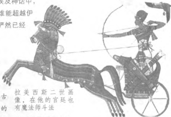
拉美西斯二世画像，在他的宫廷也有魔法师斗法

沙·耐赫赛特的转世。而我就是1500年前的沙·帕尼特赫。我将再次接受他的挑战！”接下来便是两位大魔法师