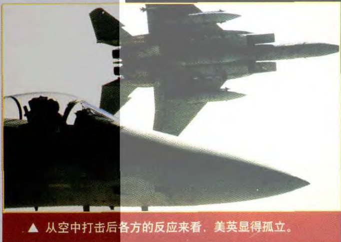
▲ 从空中打击后各方的反应来看,美英显得孤立。

伊拉克问题,可说是老布什留给克林顿、克林顿又还给小布什的棘手问题。看来,布什“新官上任三把火”,决意一定要尽快除掉萨达姆。然而,对伊更强硬的政策不会带来更好的结果。如果说十年前伊入侵科威特,多国部队发动“沙漠风暴”,尚得到许多国家的支持和参与,那么今天,许多国家调整对伊政策,伊的国际环境已大有改善。长期的制裁使伊成为“受害者”而得到国际社会的同情。从空中打击后各方的反应来看,美英受到各方谴责而显得孤立。同时美英绕开联合国擅自对伊实施军事行动,对于目前正在筹备中的联合国与伊拉克的对话亦是一个打击,将有损于恢复对伊武器核查的国际努力。