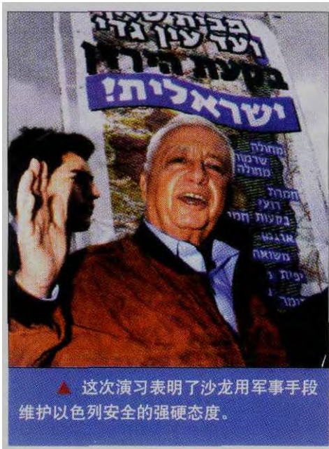
▲ 这次演习表明了沙龙用军事手段维护以色列安全的强硬态度。

在接受媒体采访时,美国军方暗示说,这次大规模联合实战演习与当前中东地区的紧张局势无关,但许多分析家认为,即使这次演习是早就计划好的,从该演习选择的时机、基本内容看,中东地区日益严峻的局势无疑是这次演习的“催