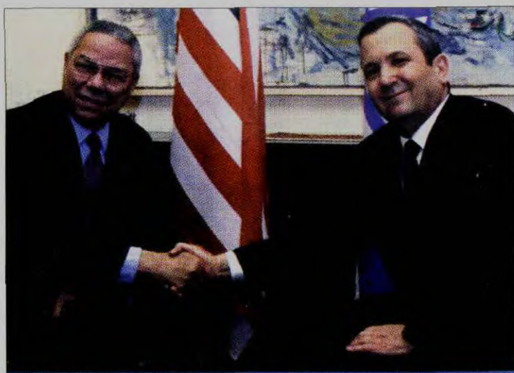
▲ 美以的联合军事演习更大可能是着眼于防止战争发生的一种威慑性手段。

势分析,此后很可能引发一场新的阿以大战。但即使不考虑国际社会要求中东地区稳定的因素,仅从美国、以色列和阿拉伯国家几个主要当事方来看,都不愿意或没有进行第六次中东大战的心理准备。