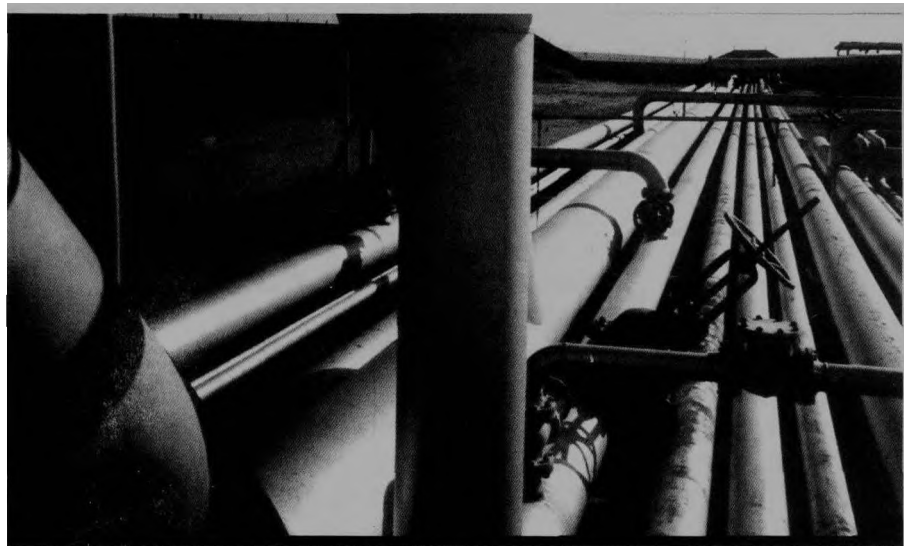
▲ 对美国来说，取得对中东中亚石油的控制权，具有生死攸关的战略意义。

美伊之间的眉目传情表达了两国急于改善二十年敌对关系的愿望，尤其是美国，其急切之心情溢于言表。美国新政府成立以来，至今尚未制定出完整外交政策，在这个时候，美国为何如此急于改善同伊朗的关系呢？