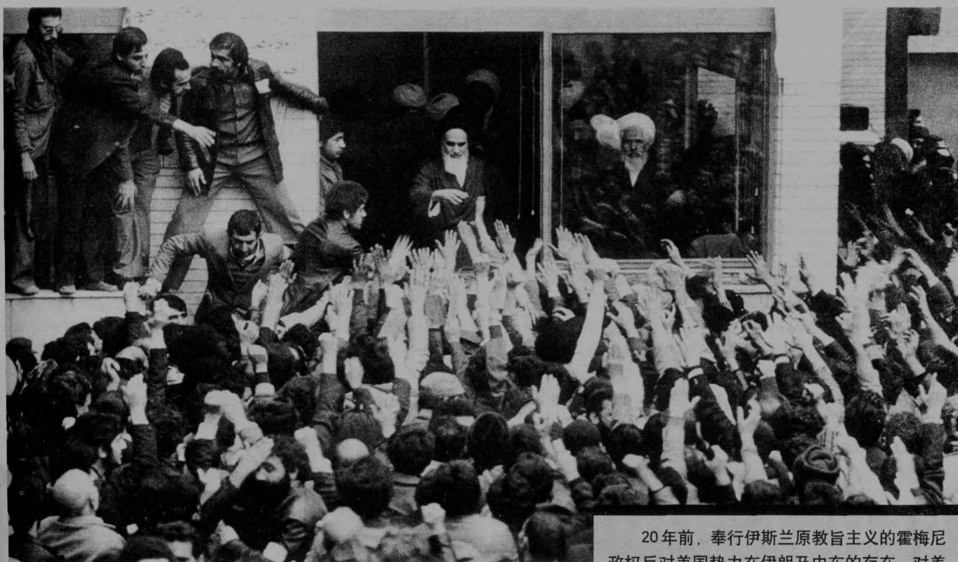
20年前,奉行伊斯兰原教旨主义的霍梅尼政权反对美国势力在伊朗及中东的存在,对美采取敌对态度,从此美国和伊朗成为冤家对头。

为了自身的战略利益,美国放下大国架子,频频向伊朗伸出橄榄枝,希望能迅速改善两国关系。伊朗为发展本国经济、进行政治改革、改善国际关系甚至谋求中东地区霸权也都需要仰仗美国。因此可以预计,两国关系在今后的会得到进一步发展。但毕竟存在着二十多年的宿怨,在许多问题上,两国仍抱着相互敌视的态度,两国关系不可能像美国所希望的那样得以尽快发展。