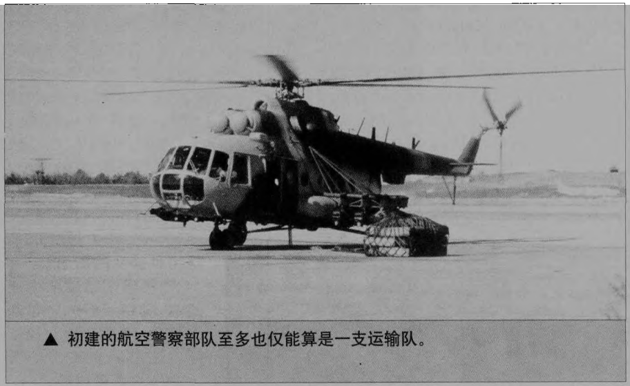
▲ 初建的航空警察部队至多也仅能算是一支运输队。

德·达赫兰上校(加沙)指挥。总情报部队由阿米纳·欣迪少将领导,负责对内对外的所有情报活动。由阿布·优素福·瓦希迪将军领导的特别安全部队在阿拉法特主席的直接监督下行动,负责发现颠覆权力机构的内部活动,搜集其他安全部队有可能威胁阿拉法特政权的情报。