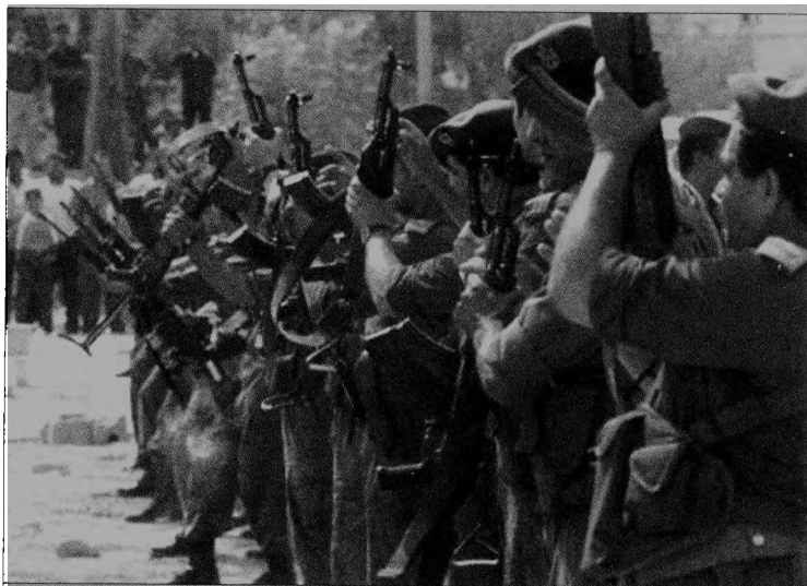
▲ 以巴勒斯坦现有的军事事实，尚无法同以色列国防军公开叫板。

为进行联合战术合作，双方组建了10个地区协调办公室(DCO)，其中8个在西岸，2个在加沙地带。地区协调办公室由巴勒斯坦方面的军官和懂阿拉伯语的以色列军官共同组成，这些以色列军官大部分是以色列