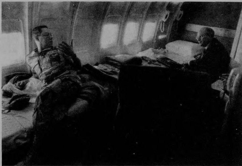
▲ 鲍威尔的人生使许多美国人觉得像一个神话。

在1996年和2000年的大选时期，鲍威尔的支持者们一直希望他能参加总统角逐，至少竞选副总统。他们把他比作这个国家唯一有足够道德水准，能够解决党派纷争、治愈民族创伤的人。鲍威尔两次都表示不感兴趣，只提供了出任国务卿的可能性。里根时代的国防部长韦恩伯格评价说：“（对于鲍威尔）国务卿是最合适的位置。”然而，美国国内也有一些人对他持不同意见。有人曾经提出质疑，鲍威尔做事喜欢深思熟虑，会否不适应国务卿这种“疯狂”的工作方式。但与他共过事的人都表示，他做事很果断，一旦决定了就不会回头。1992年曾经为鲍威尔撰写传记的作家米恩斯