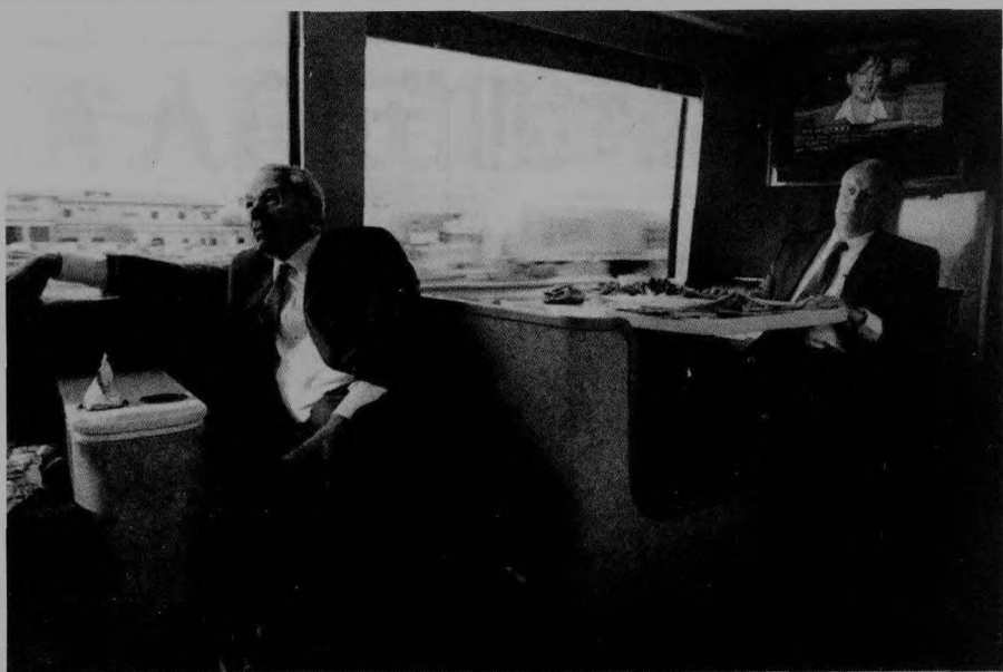
▲ 看来鲍威尔也在思考，在冷战后的世界中，如何将自己偏狭的信条与美国广泛的战略利益相结合。