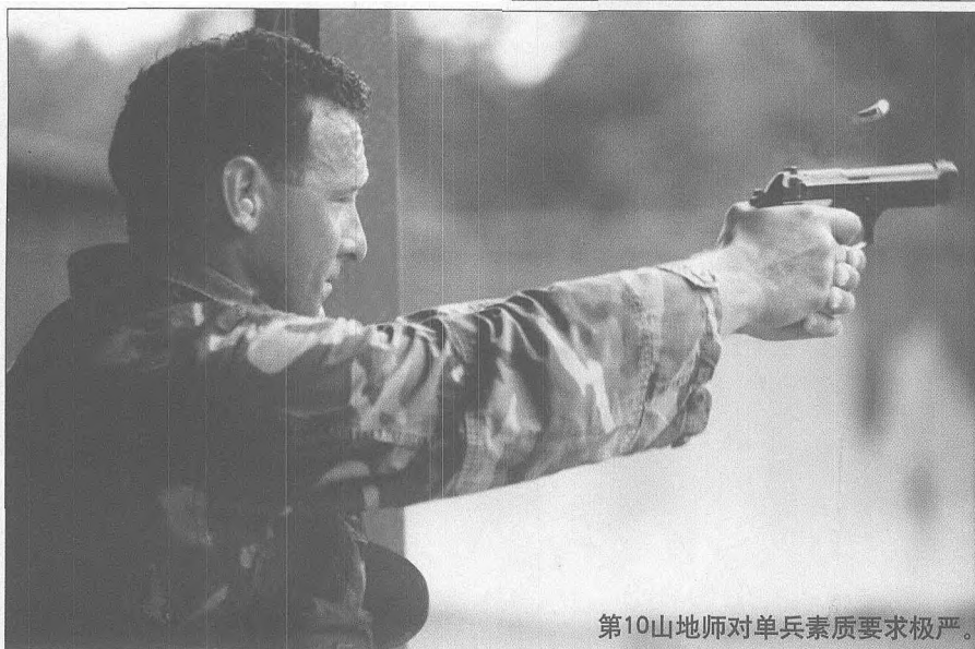
第10山地师对单兵素质要求极严。

OH-58D 侦察直升机31架、EH-60电子战直升机3架、陶式反坦克导弹系统44部、轻标枪反坦克导弹系统162部、105毫米轻型牵引榴弹炮54门、155毫米轻型牵引榴弹炮8门、81毫米迫击炮36门、60毫米迫击炮54门、复仇者防空导弹系统36部、毒刺便携式防空导弹40部、40毫米榴弹发射器831具、M-60机枪918挺、12.7毫米重机枪47挺、M-16A2自动步枪9818支、各型无线电台2449部、各种夜视器材1200余件、各种车辆2360余部。