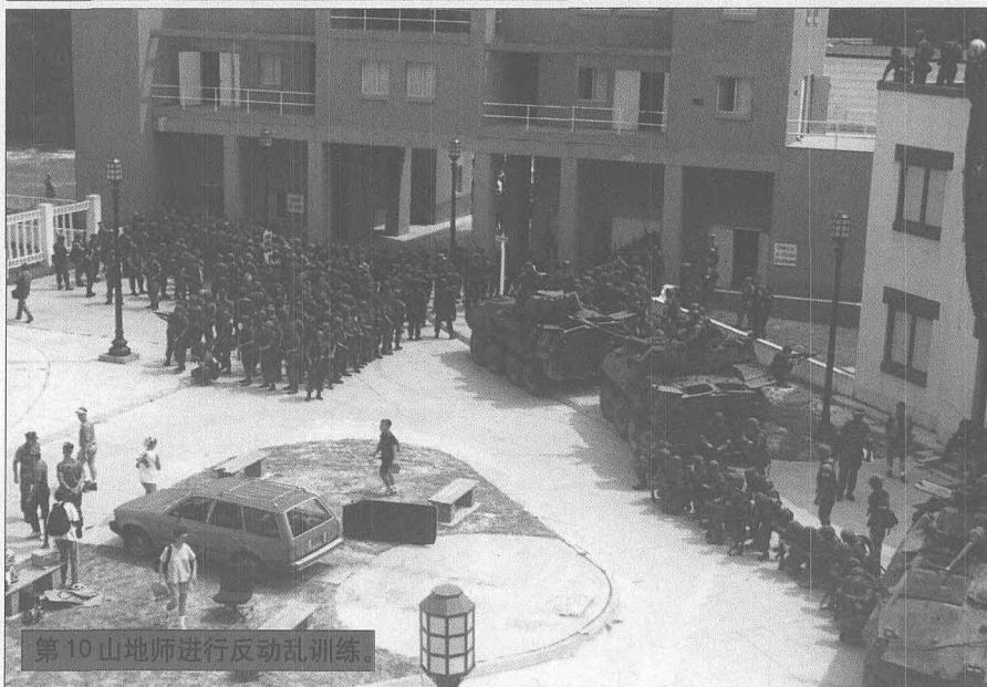
第10山地师进行反乱训练。