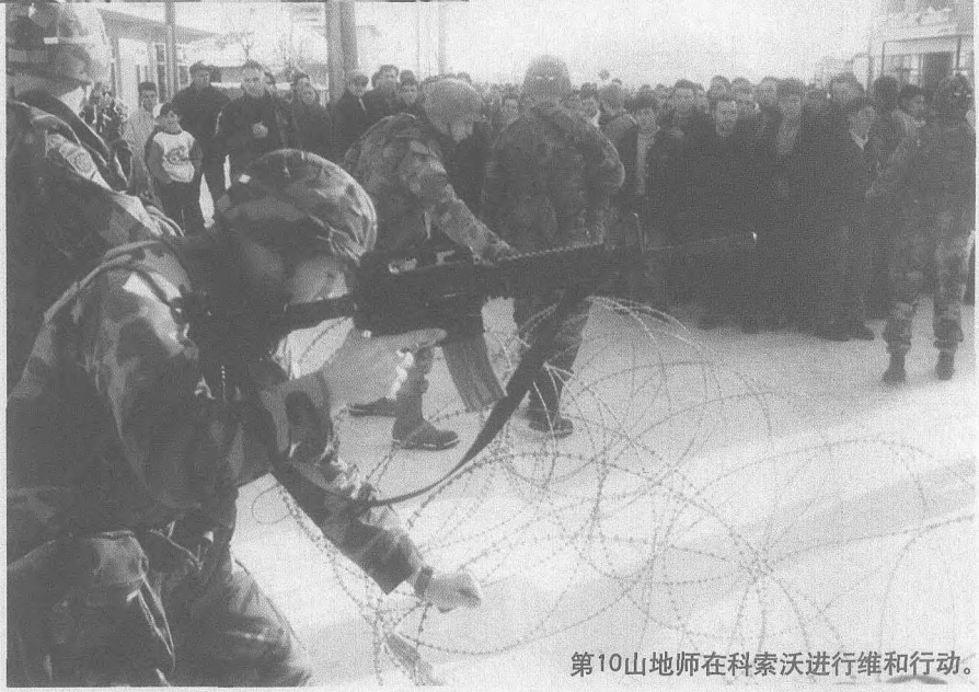
第10山地师在科索沃进行维和行动。

在阿富汗，夜战模式相当吃重。第10山地师装备各类夜视器材1200余件。师航空旅全部战斗与运输直升机都配备夜视系统，能够在夜间起飞和机降并识别和攻击目标。阿帕奇直升机的PNNS夜视系统在夜间对运动目标的探测距离达12公里，识别和攻击距离为7公里。全师基本作战单位和步兵班组均配备夜视仪和夜视镜900余件，可进行夜间观察。3个步兵旅的98部陶式和轻标枪反坦克导弹发射架用AN/TAS-4热成像瞄准仪可在夜间对2—6公里的工事、装甲目标进行探测和瞄准射击。