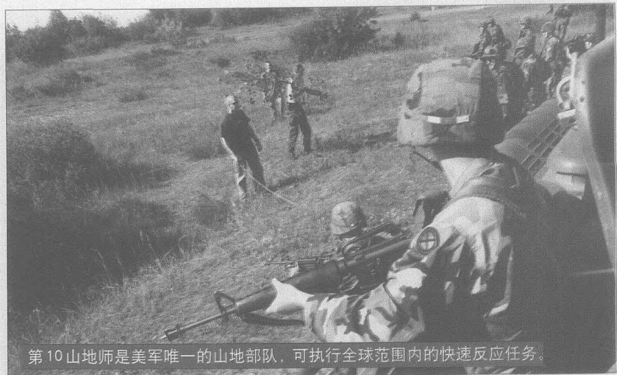
第10山地师是美军唯一的山地部队，可执行全球范围内的快速反应任务。

1945年1月28日，第10山地师在意大利贝尔韦代雷山投入战斗，第10山地师第86山地团第1营和第2营F连担负攻占里瓦里奇的任务。经过周密侦察后，第86团决定在夜间沿1500米的陡峭悬崖实施攻击。德军认为根本不可能有人能从悬崖爬上山脊，只