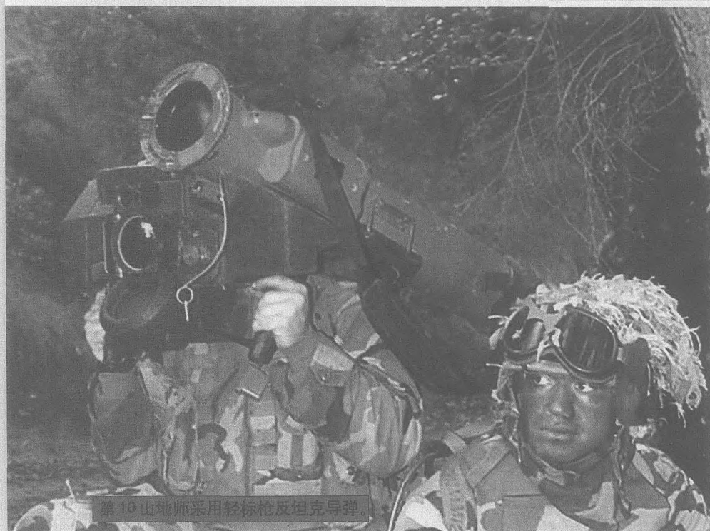
第10山地师采用轻标枪反坦克导弹。

师包括火炮、直升机、车辆在内的所有装备和人员均可通过军事空运司令部的 C-5/141/17 运输机快速投送。战术机动能力方面，全师编有各种作战车辆和输送车辆2360余部，各型直升机102架，具有较强的地面和空中战术机动能力。昼间地面机动速度不小于每小时30公里，夜间每小时25公里。