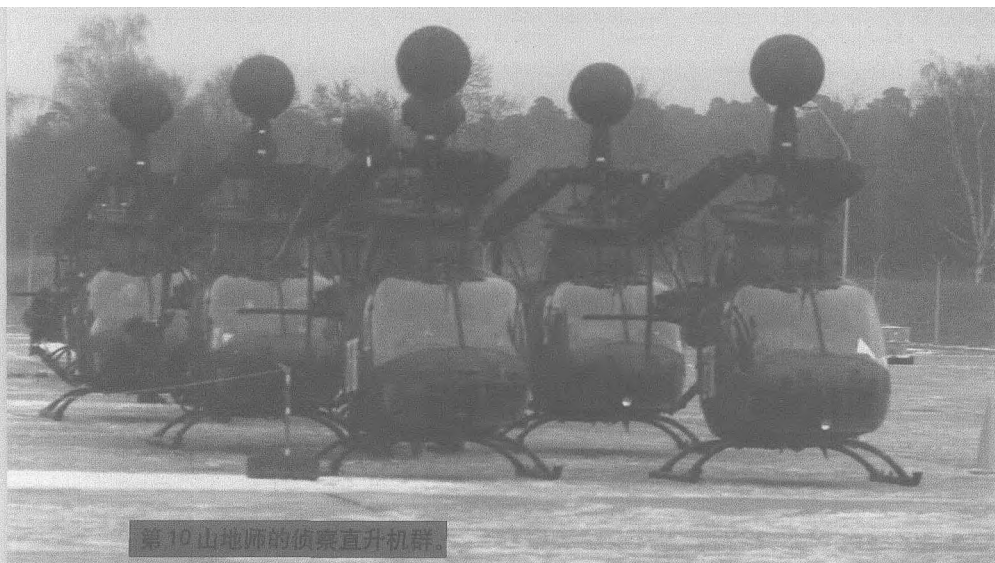
第10山地师的侦察直升机群。