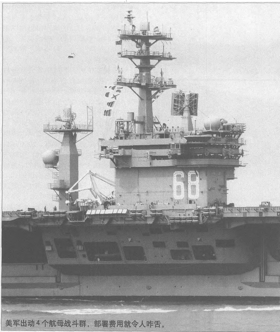
美军出动4个航母战斗群，部署费用就令人咋舌。

早在轰炸塔利班之前，军事专家就曾向美国五角大楼发出警告说，鉴于阿富汗特殊的地形状况和天气条件，战争不可能很快就结束，美军引以为豪的高技术兵器也很可能发挥不上什么用场。让“命比天高”的美军冒险出动一架价值6000多万美元的飞机，以每个飞行架次10万美元为代价，使用价值4万美元的弹药，去打击一辆不值几个钱的军用车辆，或炸毁一个没有战略意义的据点或桥梁，从经济效费比的角度来说是极不合算的。布什总统就曾这样问过自己：“如果用一枚价值100万美元的导弹击中了一个价值不过10美元的帐篷，那又有什么意义呢？”而且随着战争的进行，美军官员越来越发现，美军使用的先进武器和弹药在作战效果和资金耗费上存在着巨大的差距，而这种“得不偿失”的尴尬势头无疑还会随着阿富汗冬季和地面战争的到来变得更为明显。据军事专家估计，如果美军在阿富汗的战争就这样无限期拖下去，美国人将再次陷入“越战泥潭”。届时，美国将不仅难以支付庞大的战争开支，而且搞不好只会落得个“赔本”的下场。