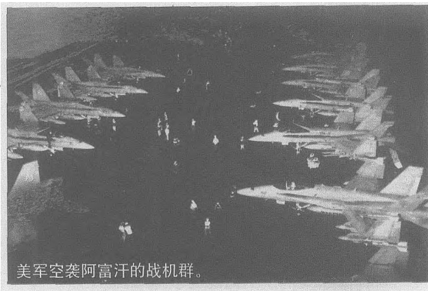
美军空袭阿富汗的战机群。

款项中的 200 亿美元用于对恐怖分子的军事打击，其它部分则用于纽约的救援和重建、反生化恐怖袭击以及其它安全保卫。美国国防部副部长沃尔福威茨表示，政府和国会的全力支持是对恐怖分子的严重警告——美国将动用一切资源打击恐怖主