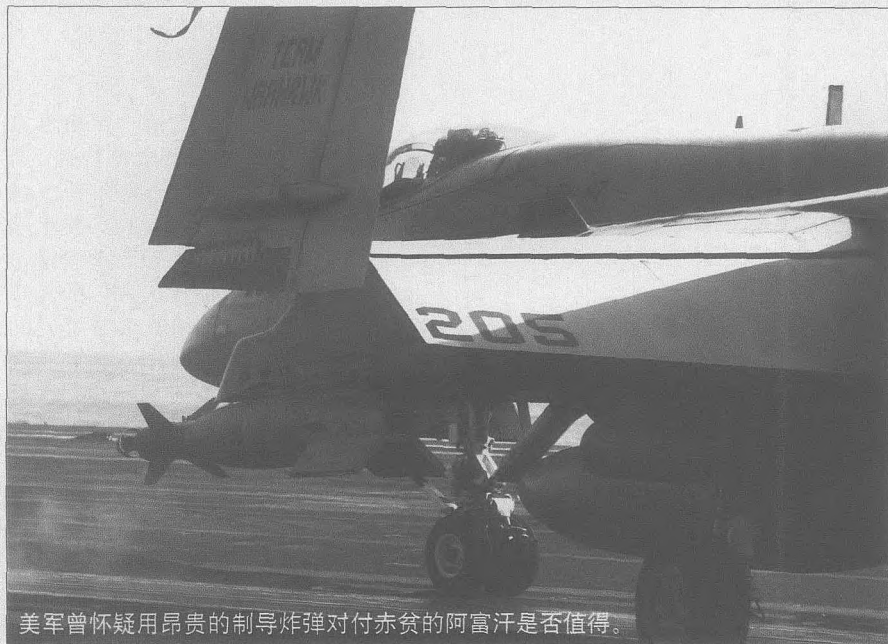
美军曾怀疑用昂贵的制导炸弹对付赤贫的阿富汗是否值得。