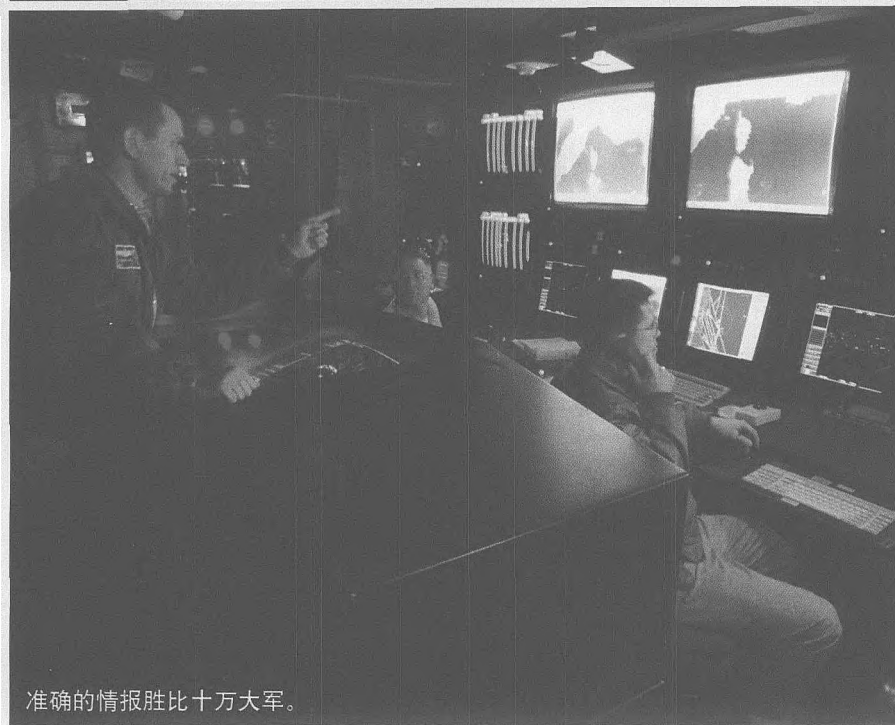
准确的情报胜比十万大军。

局的最终目标是通过策动倒戈，煽动内乱，谋求从内部推翻塔利班政权。据反塔联盟的情报人员称，变节和阴谋已成为与 AK-47 和毒刺导弹具有同样威力的武器。已有 30 多位塔利班军官在他们的策动下倒戈，另外还有不少潜伏人员留在塔利班军队内，随时准备里应外合。