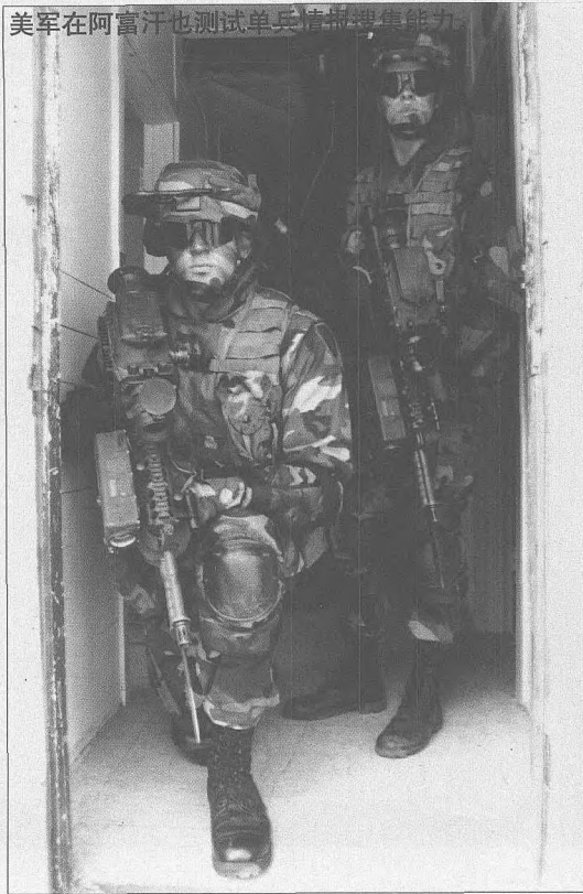
美军在阿富汗也测试单兵情报搜集能力。

府和情报界在反省造成这一悲剧的原因时，都一致认为中情局人力情报工作不力是最关键的因素，而导致人力情报方面出现漏洞的直接原因则是美国政府的行政法规和命令束缚了中情局的手脚。布什政府虽然还未明确宣布推翻前总统卡特于 1978 年颁布的关于禁止中情局参与或策划暗杀等秘密行动的行政命令，但已事实上完全放松了对中情局的约束，给中情局在阿开展秘密行动开了绿灯。据 10 月 15 日《华盛顿邮报》报导，布什政府近日已签署命令，要求中央情报局开展自 1947 年创建以来“最大规模和最具毁灭性的秘密行动”，消灭拉登及其领导的“基地”组织。总统还为中情局的反恐怖行动追加了 10 亿多美元资金，其中大部分将被用于秘密行动。布什总统在签署命令时还说，希望中情局采取“高风险”的一切必要行动，“即使遭受令人尴尬的挫折也在所不惜。”