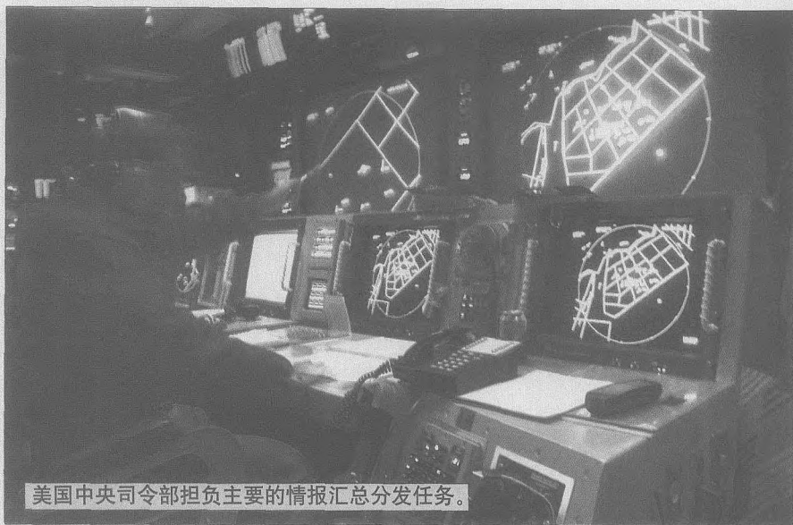
美国中央司令部担负主要的情报汇总分发任务。

新闻发布会上无奈地说：“阿拉伯世界对我们如此误解令我震惊，我们必须作出努力改变自己的形象”。更重要的是，长期以来美国对伊斯兰国家的外交政策不得人心。伊拉克人民遭受制裁之苦达十余载；中东和平进程举步维艰；利比亚、伊朗、苏丹等国因被冠以“无赖国家”恶名而长期遭受不公正待遇；所有这些都直接诱发了阿拉伯世界日渐高涨的反美情绪。