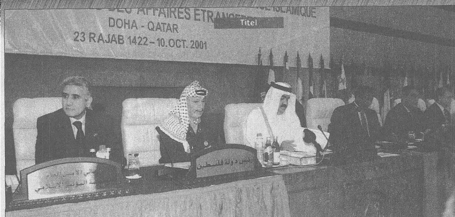
阿拉伯国家的团结一致有助于巴以冲突和中东问题的解决。