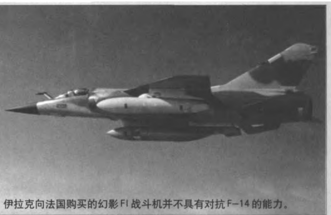
伊拉克向法国购买的幻影F1战斗机并不具有对抗F-14的能力。

1980年9月22日拂晓，伊拉克宣布：“给伊朗以决定性打击。”萨达姆决心仿效当年希特勒的闪电行动，以最具优势的空中力量在第一天就将伊朗的空军基本打垮。