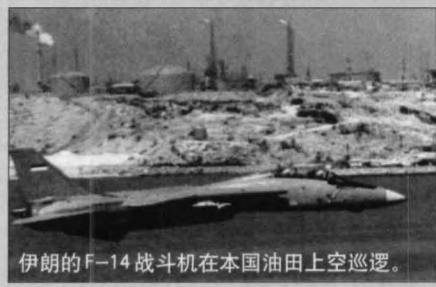
伊朗的F-14战斗机在本国油田上空巡逻。

但F-14的阴影对伊拉克飞行员却是难以克服的，阿德南讲：“我们对F-14的AWG-9雷达特别敏感，只要F-14一到，所有伊拉克战机马上四散奔逃，连一架都不留。”萨达姆亲自出马，向法国达索公司求购被称为“幻影怪