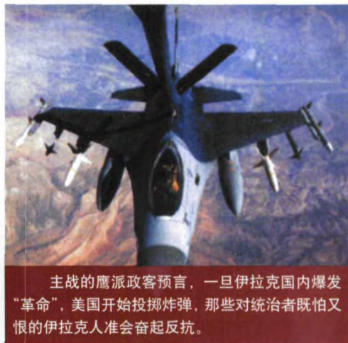
主战的鹰派政客预言，一旦伊拉克国内爆发“革命”，美国开始投掷炸弹，那些对统治者既怕又恨的伊拉克人准会奋起反抗。

也有行家认为，中央情报局对“卑鄙伎俩”嗜之如癖，常因此带来事与愿违的后果，在这场同“邪恶”的较量中未必能给布什政府帮多大的忙。上世纪50年代后期，其特工就曾雇佣三级片影星拍下印尼总统苏加诺与妓女鬼混的镜