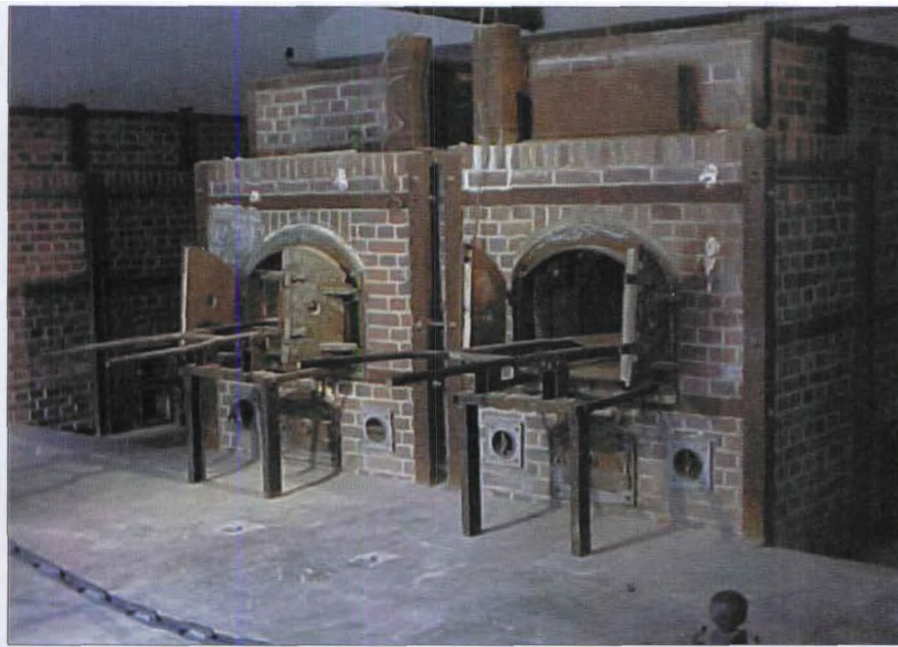
■ 臭名昭著的奥斯维辛集中营里的焚尸炉。

级行政机构和军事组织，欧洲的手工业行会又把犹太人排斥在外，甚至不被允许购买不动产，他们唯一剩下的生存道路就只是放贷和经商了。而他们的经商才华反过来又成为社会嫉妒、蔑视和迫害他们的理由和“罪过”。在某种意义上说，是苦难和无奈催化了犹太人的商业技能。