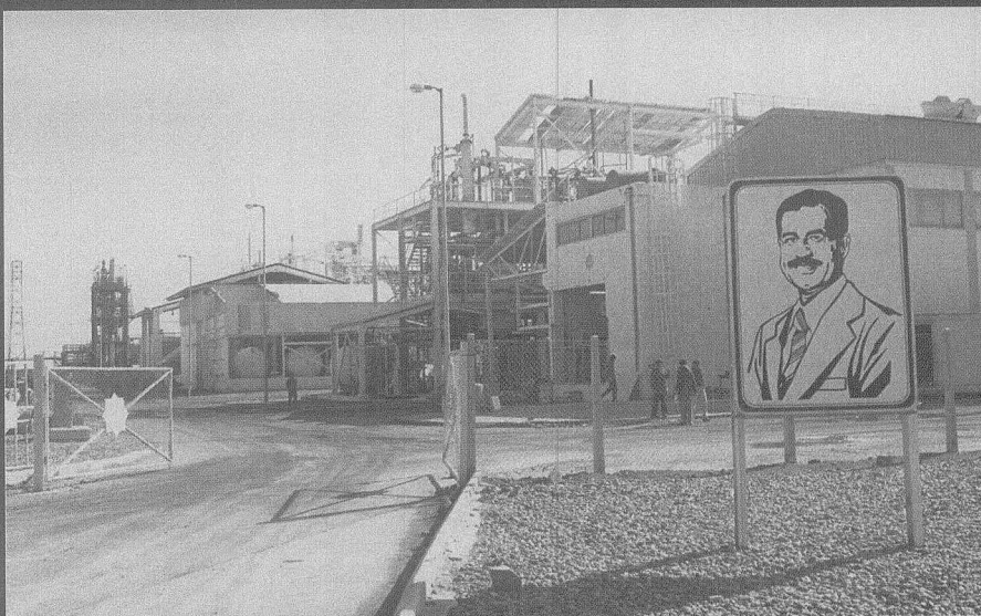
■ 据说已有美国军方及情报人员秘密潜入伊拉克北部,准备按计划推翻总统萨达姆。