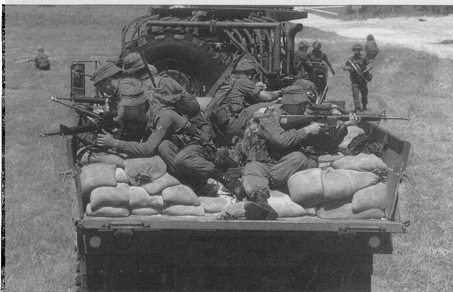
■ 截止2001年12月,美国派驻海湾针对伊拉克的兵力已从2万余人增加到4万多人。

英国一位军方消息人士说,英国与美国均已派遣特种部队进入伊拉克,准备煽动反对势力作乱,为英美大举入侵伊拉克铺路。美国和英国的特种部队目前正在靠近伊拉克的卡塔尔、巴林、科威特等国境内沙漠地带悄悄兴建“帐篷城”连营,打造攻击平台。该消息人士还透露,英国已经从巴尔干半岛和阿富汗召回部队,为攻击伊拉克展开训练。英国参与入侵的兵力包括一个步兵师及数个装甲旅,另外还将出动50架战机和航空母舰战斗群。目前,英国海军最现代的“海洋号”直升机航空母舰正在做参战前的检修工作。“海洋号”航母是英国海军最大的军舰,配备了18架