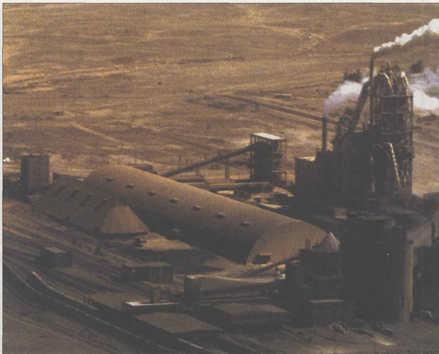
■ 曾任美国总统国家安全顾问的布热津斯基撰文称:如“倒萨”必须诉诸战争,战争应是以承认美国全球主导地位方式发动的,且战争有助于建立美国能承担更大责任的国际新秩序。

联合国秘书长安南9月11日在一份提前公开的讲话稿中说,根据联合国宪章,任何遭到袭击的国家才有自卫权。强烈反对美国对伊拉克采取单边军事行动的安南说,伊拉克问题应该由安理会讨论解决。他同时呼吁伊拉克尽快允许联合国武器核查人员进入伊拉克,恢复武器核查工作。一位联合国官员认为,安南抢在美国总统布什发表针对伊拉克的讲话前公开他的讲