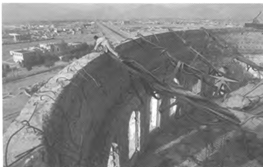
重建中的阿富汗国家博物馆

的资助形式正在由政府捐助转向非政府组织 (NGOs) 捐助。譬如, 位于瑞士日内瓦的 Aga Khan Trust 组织承诺为阿富汗各种文化遗产保护工程捐助 500 万美元。然而, 这种投放方式也播下了