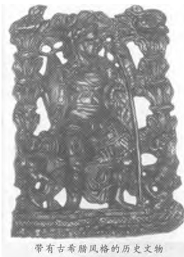
带有古希腊风格的历史文物

遗憾之三 位于 Kapisa 附近喀布尔北部的一个地区是那些幸免逃脱盗掘者魔掌的少数地区之一。这里曾是迦腻色迦王统治的贵霜王国的中心。迦腻色迦王统治时期,印度佛教日渐没落。迦腻色迦王积极扶持佛教,将原来佛教较为呆板的象征形式,譬如车轮,变成了以佛像为中心的象征形式,使之成为一种更为鲜活的宗教。这种复兴的佛教很快便沿着丝绸之路向北传入中国,向东传入日本。不幸的是,到了公元 5 世纪,阿富汗的佛教王国被来自东部的印度入侵者和信奉伊斯兰教的阿拉伯军队所毁灭。研究学者们希望能在这一地区找到新的证据来证实这些史实。