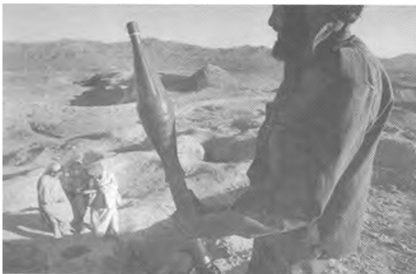
阿富汗东部的古文明遗址目前已得到有限的保护

古学家、文物保护主义者和政府官员们达成共识，制订并启动了营救阿富汗文化遗产计划。外国政府许诺投入大约 700 万美元用于重建被损毁的国家博物馆，修复被损的古器物以及加固岌岌可危的遗址。但是，计划的实施却困难重重。