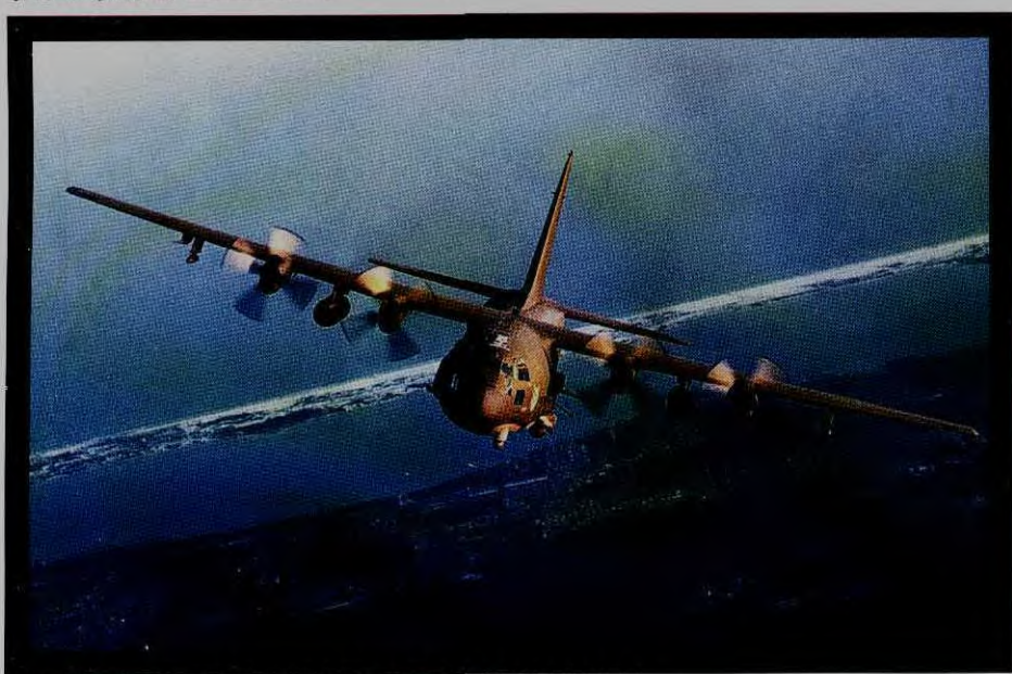
号称“空中炮艇”的AC-130H既能进行火力支援，也可成为反恐兵力投放的主要工具

是我们美国目前最危险的敌人。在这一点上他们是没有先后之分的。但由于他们力量不同，我们要不同对待。对付萨达姆，我们要大胆用兵，造成大兵压境之势，让这个混蛋尽快拱手让出城池。对付拉登，不必动用太多的地面部队，可以动用精兵出奇制胜。‘总统高见！总统高见！’话音未落，各位一致点头称是。布什扫视了一下全场，清了清嗓子坚定地说：‘我命令山驻海湾的中央总部立即再制订一份精密的行动方案，坚决灭掉拉登！记住，死吊都要，以DNA测定为准！’