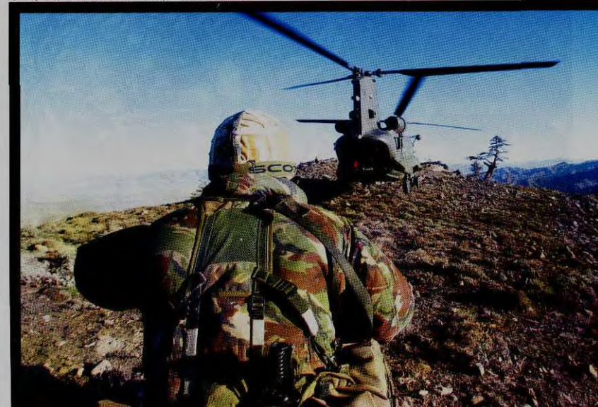
美军特种部队潜入拉登活动区域，准备捕捉行动