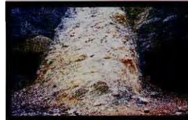
在美军一轮狂轰滥炸之后，昔日拉登住过的据点成为一片瓦砾。而拉登全飞了