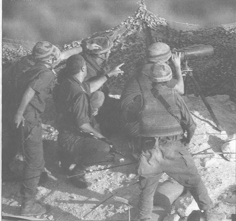
以色列士兵在巴勒斯坦拜特贾拉村对面构筑的工事，密切监视着对面的情况。

在解决水资源分配问题上，以色列认为，一是中东水系是一个整体，中东地区的水资源应该为中东所有国家造福，埃及、土耳其等富水国家和以色列、约旦以及巴勒斯