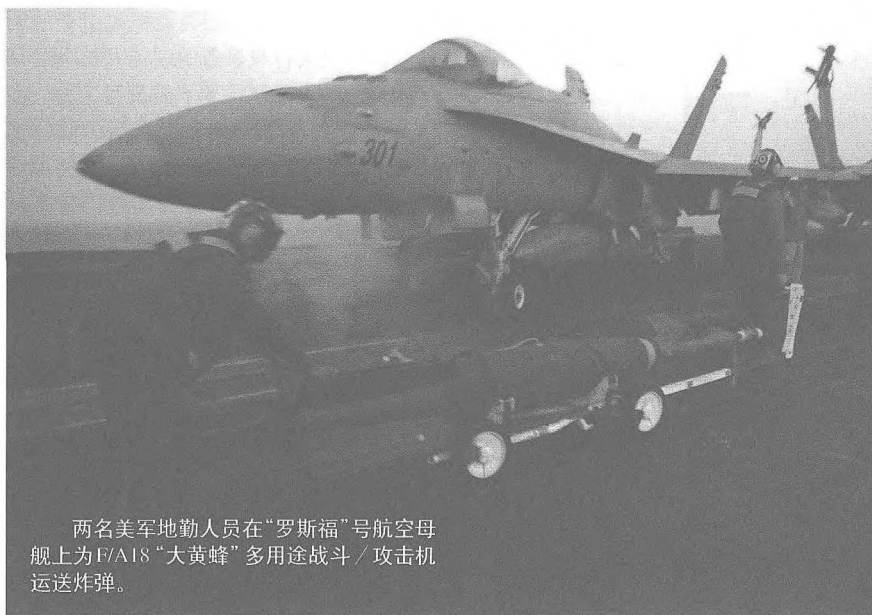
两名美军地勤人员在“罗斯福”号航空母舰上为F/A-18“大黄蜂”多用途战斗/攻击机运送炸弹。