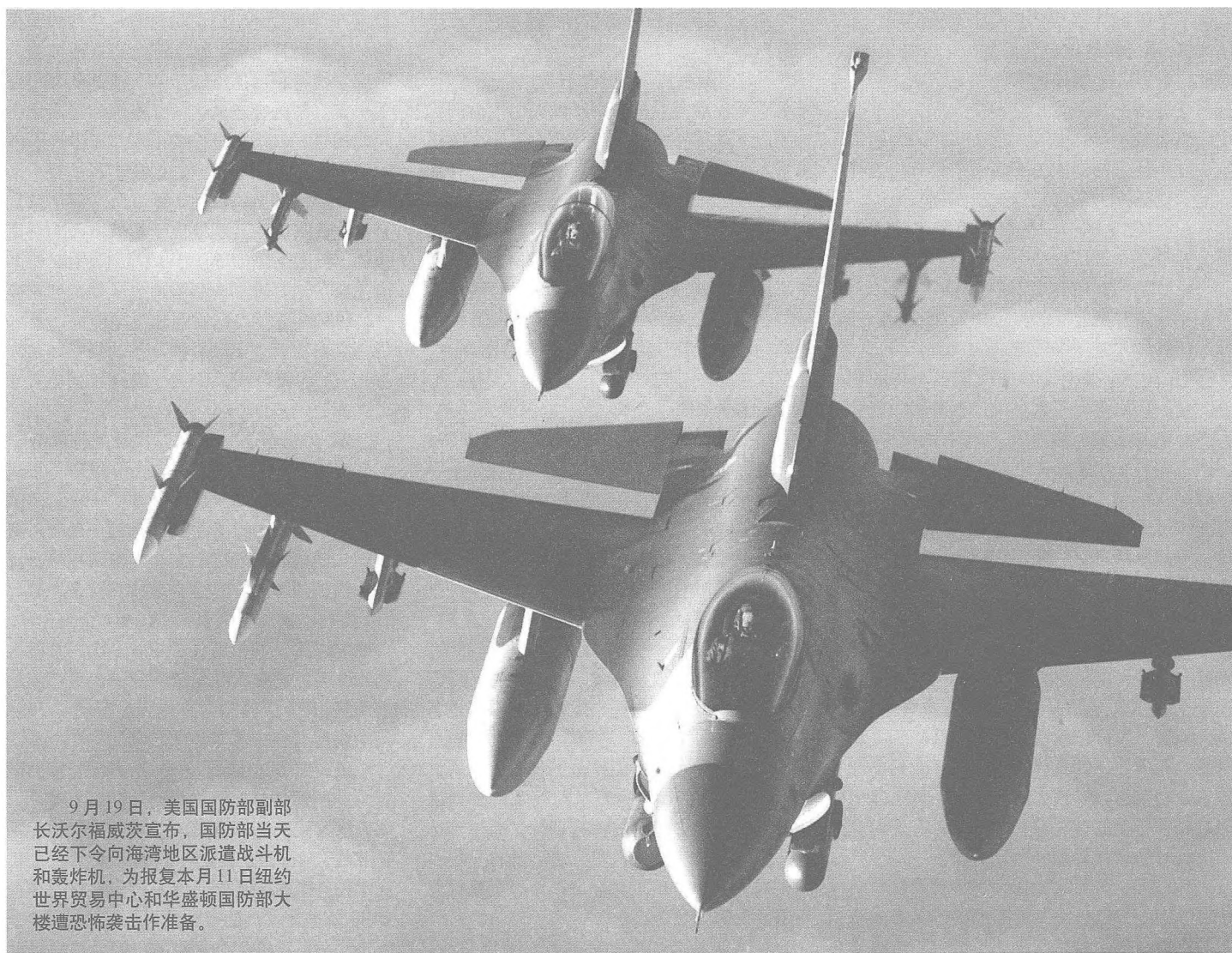
9月19日，美国国防部副部长沃尔福威茨宣布，国防部当天已经下令向海湾地区派遣战斗机和轰炸机，为报复本月11日纽约世界贸易中心和华盛顿国防部大楼遭恐怖袭击作准备。