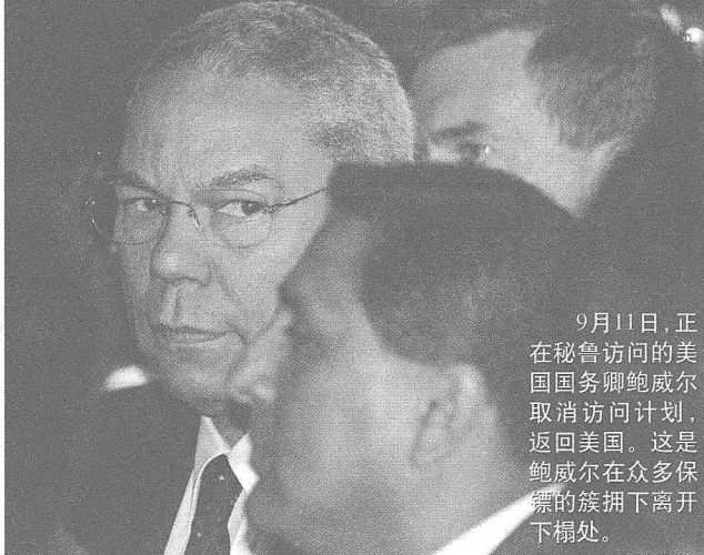
9月11日，正在秘鲁访问的美国国务卿鲍威尔取消访问计划，返回美国。这是鲍威尔在众多保镖的簇拥下离开下榻处。