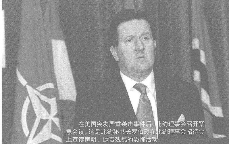
在美国突发严重袭击事件后，北约理事会召开紧急会议。这是北约秘书长罗伯逊在北约理事会招待会上宣读声明，谴责残酷的恐怖活动。