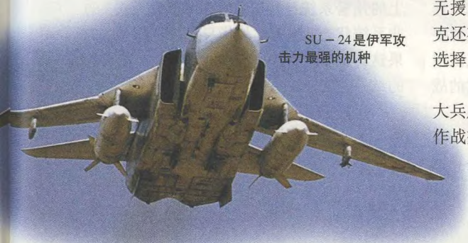
SU-24 是伊军攻击力最强的机种

花钱和时间这几个方面的综合效益考虑的。谁都明白,要打仗就要准备死人,这是任何军队都不能避免的。美军认为:在几次大的战争中,美军的死伤人员主要集中在步兵参加的地面作战中。据美军自己统计:第一次世界大战中,19个月的作战,22.4万伤亡人员中,19.5万人是步兵,占87%。二次大战中,44个月的作战,82.3万伤亡人员中,66.1万人是步兵,占80%。朝鲜战争中,步兵的伤亡数占84%。在84个月的越南战争中,伤亡达23.3万人,18.4万人也是步兵,占80%左右。其中海军陆战队死亡12931人,陆军28800人,海军1242人,空军虽然出动50余万架次,投弹达129万吨,但仅仅伤亡552人。空军伤亡的人数明显少于陆、海军的原因是因为直接上前线的人员与指挥保障人员的比例,空军是1:70,陆