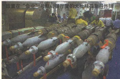
放置在“企业”号航母餐厅里的大批精确制导炸弹