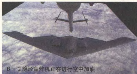
B-2 隐形轰炸机正在进行空中加油