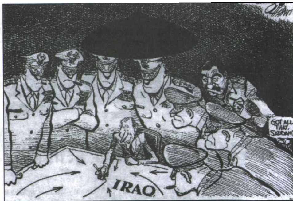
美国报纸刊登的一幅漫画——小布什在部署进攻伊拉克。旁边小字意为：都明白了吗，萨达姆？

1991年底，萨达姆回老家底克里特镇休养，他的专用防弹汽车在中途突然发生爆炸，但他并未受伤。1995年7月，美中央情报局制定了一个代号为“梦境行动”的计划，准备除掉萨达姆。结果萨达姆得知了“梦境行动”的全部内容，美中央情报局苦心经营了近一年的阴谋破产，80多名伊拉克高级军官被捕。1996年，被美中央情报局收买的一名女服务员企图在萨达姆的饭里下毒，但最后因为她太害怕而露了馅儿。