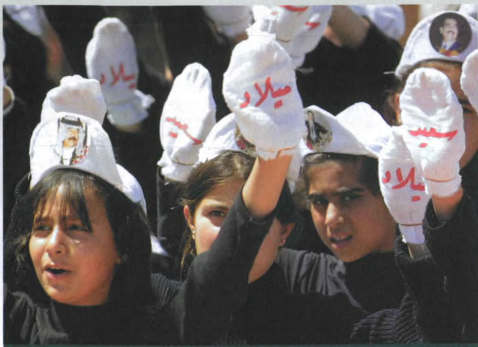
4月29日，在伊拉克北部城市卡尔库克，学生们挥舞写着“生日快乐”字样的手套，庆祝伊拉克总统萨达姆65岁生日。

康和精神状况，还是时间，都不允许他这样做。而用替身完成此类简单机械的工作则比较合适，无需立即对群众提出的问题做出决定，事后再由有关人员处理。