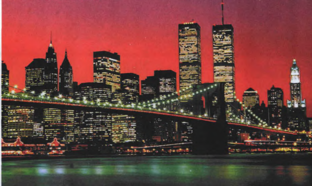
这是2000年6月20日拍摄的纽约曼哈顿岛夜色。在这张照片中，世贸大楼灯火通明，非常漂亮。

一名塔利班政权的前副外长透露说，今年4月，就在萨达姆政权垮台后不久，本·拉登在阿富汗深山据点中召开了自“9·11”以来规模最大的一次恐怖峰会。参加此次恐怖峰会的包括塔利班的3名高级代表、“基地”