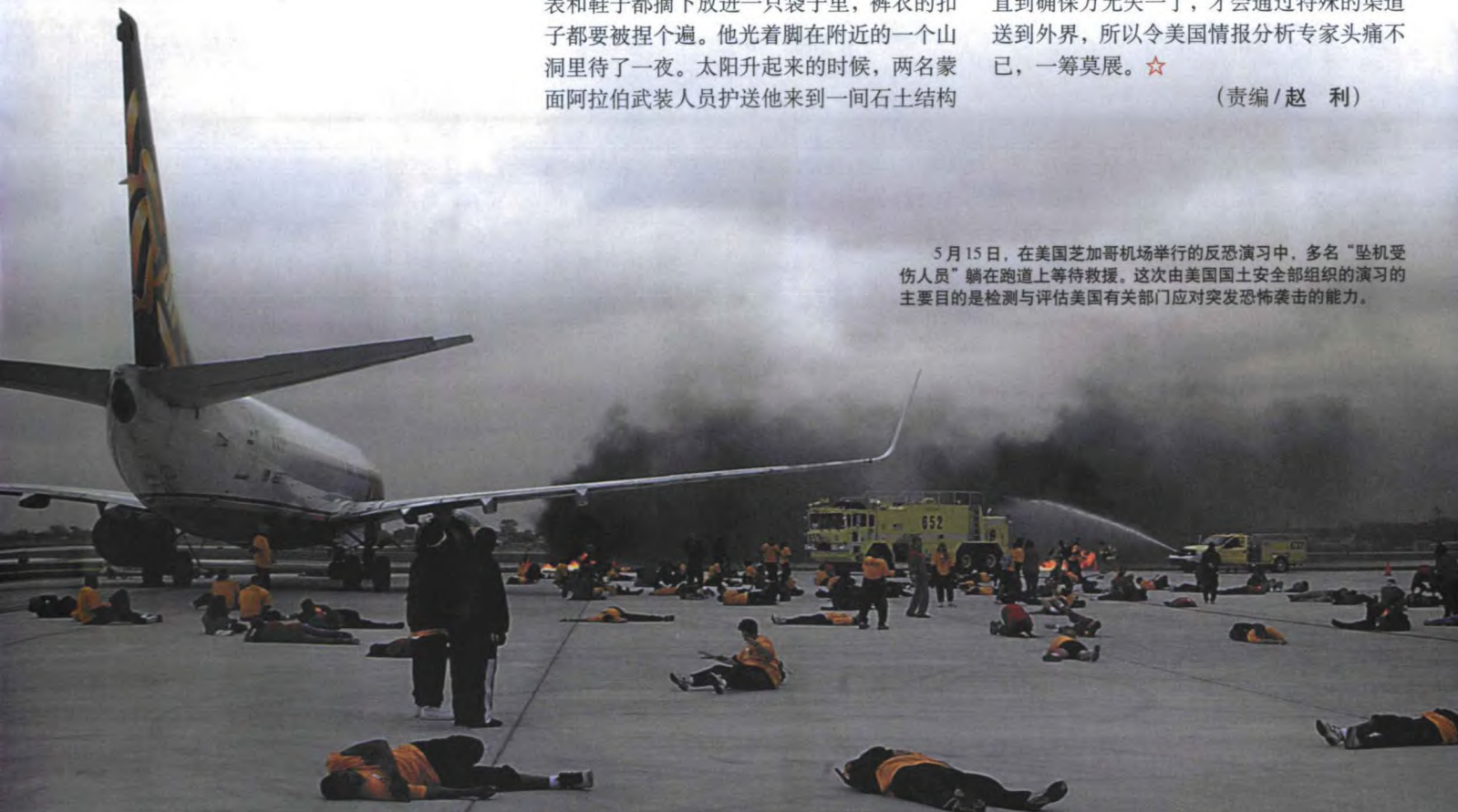
5月15日,在美国芝加哥机场举行的反恐演习中,多名“坠机受伤人员”躺在跑道上等待救援。这次由美国国土安全部组织的演习的主要目的是检测与评估美国有关部门应对突发恐怖袭击的能力。