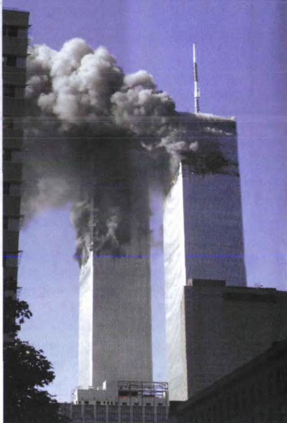
2001年9月11日，美国纽约世界贸易中心遭到袭击并被摧毁。

本·拉登的录像带播出之时，美国上下正在纪念“9·11”两周年。这是一个极其敏感的日子。本·拉登有意选择此时露面，是对美国的公然挑衅，让美国民众再度陷入恐慌和混乱之中，让布什政府及其反恐战争威信扫地。此举果然奏效。本·拉登也不愧为