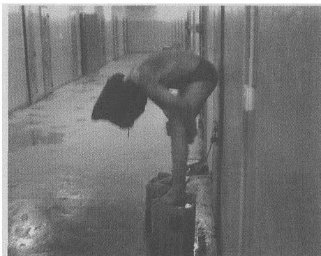
虐俘事件让驻伊美军颜面尽失