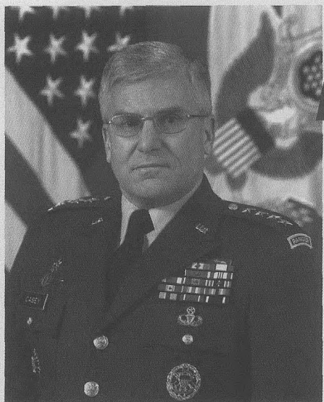
美国陆军第一副参谋长乔治·凯西上将。6月15日，美国五角大楼发布通告宣布，布什总统已经提名陆军第一副参谋长乔治·凯西上将担任驻伊联军最高指挥官，接替桑切斯中将。

6月15日，美国国防部发布声明称，布什总统已提名四星上将、现任陆军副参谋长乔治·W·凯西替换里卡多·桑切斯中将，成为驻伊拉克多国部队最高统帅，统领目前在伊拉克的所有军事单位、特别行动组以及负责搜寻大规模杀伤性武器的伊拉克观察组，并与美国驻伊拉克大使内格罗蓬特一起负责开展伊拉克自治和重建进程。尽管五角大楼强调驻伊美军司令这一职位调换与美军虐囚事件无关，但是国际分析人士指出，美国政府走马换将是正在为美军虐囚事件寻找替罪羊。尽管凯西将军在这之前并不为公众所熟悉，却能荣升伊拉克多国部队“总管”，成为“无可争议的人选”，这与其所具备的深厚背景有关。然而凯西接收一个烂摊子后，能否重树美国形象，搞定伊拉克局面，仍是世人关注的一个问题。