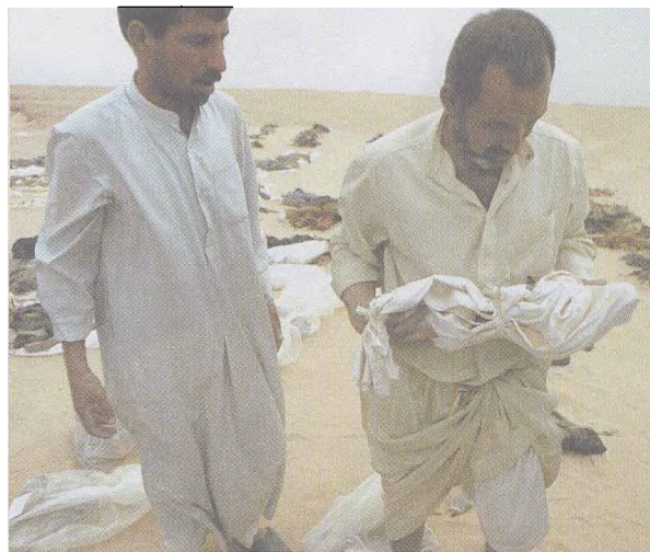
2003年5月30日,在伊拉克城市纳杰夫附近,一名男子怀抱一具儿童的骸骨离开新近发现的一个集体坟坑。在纳杰夫附近挖出的一个集体坟坑中至少有500具尸体。美国称这是萨达姆残杀平民的证据。

萨达姆自从2003年底被抓获后,结束了逃亡生活,一直“安全”地在美军的严密看管下生活着。富有戏剧性的是,声称要为正义而审判萨达姆的伊拉克特别法庭的法官们却不得不东躲西藏,提心吊胆地过日子。据说一名主审法官在接手这个案子以来从未在