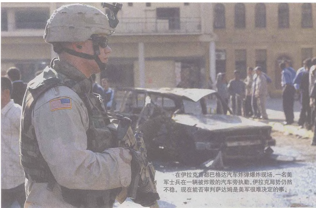
在伊拉克首都巴格达汽车炸弹爆炸现场，一名美军士兵在一辆被炸毁的汽车旁执勤，伊拉克局势仍然不稳。现在能否审判萨达姆是美军很难决定的事。