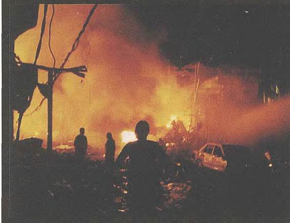
巴厘岛：2002年，与“基地”组织有关的伊斯兰恐怖分子在人数众多的夜总会引爆炸弹，造成202人死亡。