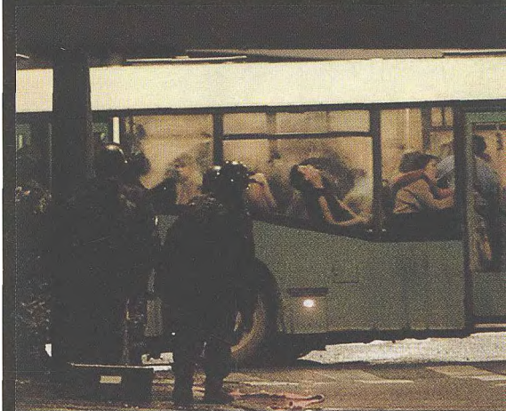
莫斯科：2002年，车臣恐怖分子劫持了800名人质。该图为一辆满载着生还者的汽车。在这次恐怖事件中，129名人质遇难。