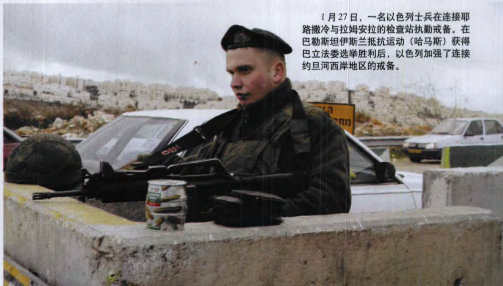
1月27日，一名以色列士兵在连接耶路撒冷与拉姆安拉的检查站执勤戒备。在巴勒斯坦伊斯兰抵抗运动（哈马斯）获得巴立法委选举胜利后，以色列加强了连接约旦河西岸地区的戒备。