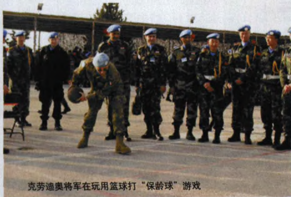
克劳迪奥将军在玩用篮球打“保龄球”游戏

随后，克劳迪奥司令和各国维和部队代表饶有兴趣地与中国军人们一起参加了游艺活动。他还亲自上阵，愉快地玩了“比眼力”、“套圈”以及用矿泉水瓶作代用品的“保龄球”。最后，克劳迪奥司令拿着“比