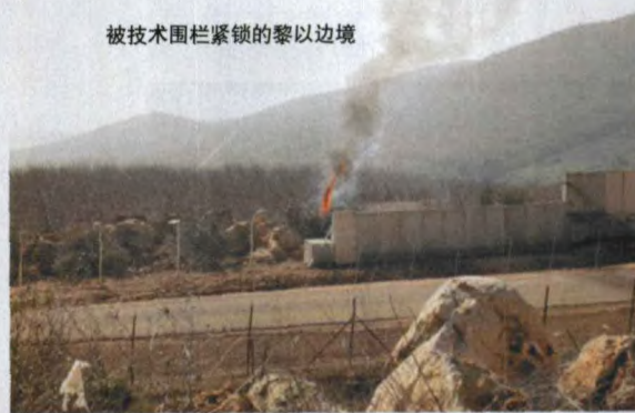
被技术围栏紧锁的黎以边境