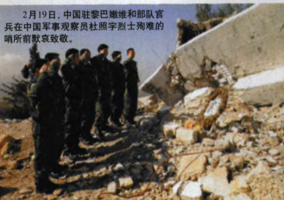
2月19日，中国驻黎巴嫩维和部队官兵在中国军事观察员杜照宇烈士殉难的哨所前默哀致敬。

路两旁不时闪过的商业广告，而一个绘有和平鸽的巨幅广告牌是那样的格外醒目，令人感慨万千。回想起刚下飞机，我驻黎巴嫩维和工兵营前来迎接的同志特意从车里拿出早已准备好的防弹背心和头盔递给我们。这时，陪同他们一道迎接我们的两位受雇于联合国的黎巴嫩女翻译，脸上掠过一丝难以察觉的苦笑。一句“不用了，