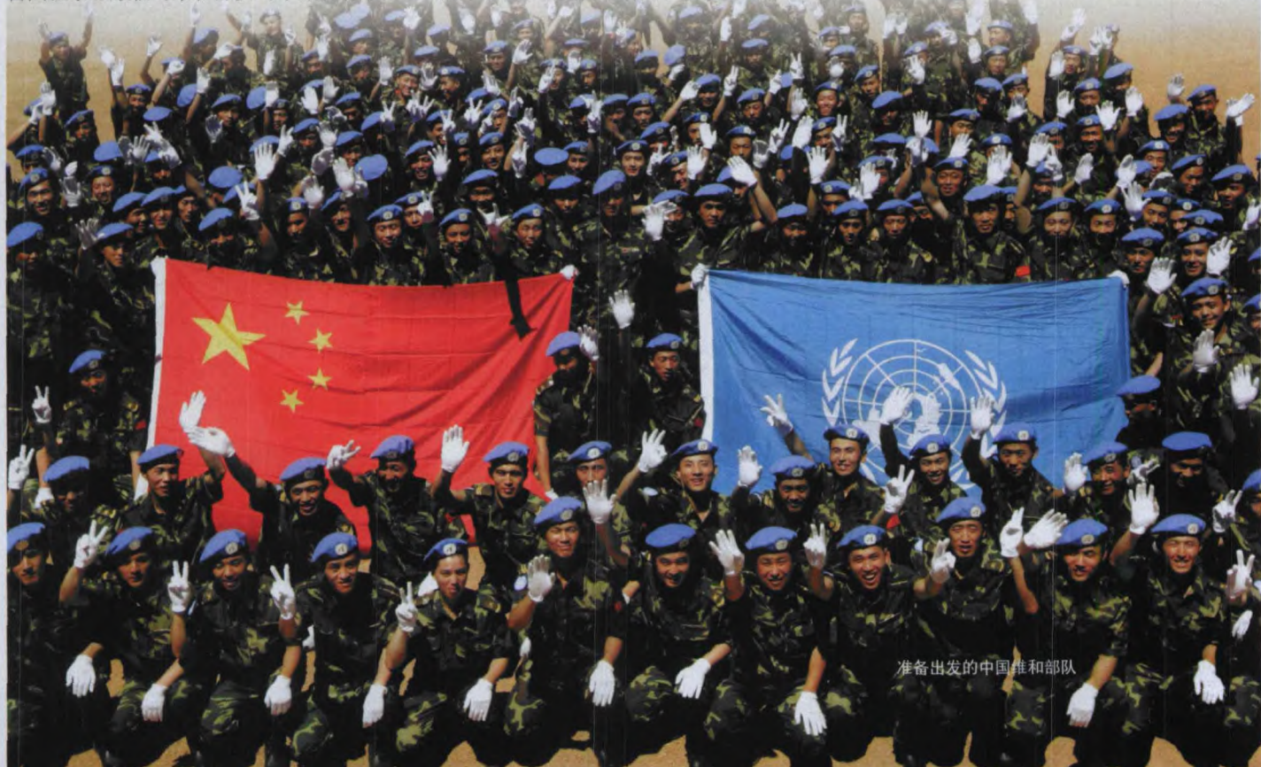
准备出发的中国维和部队