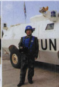
→本刊记者孙继炼在中国驻黎巴嫩维和部队工兵营工作时的情景。