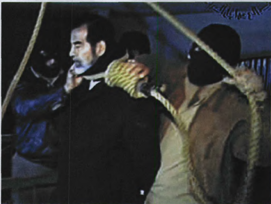
2006年12月30日，伊拉克电视台证实，伊拉克前总统萨达姆·侯赛因已经被处以绞刑。这是萨达姆被处以绞刑的电视照片。

就在美国陷入了作战时间超过第二次世界大战、伤亡人数超过越战以后的所有战争、军费消耗接近越南战争的“伊拉克泥潭”难以自拔之际，2006年11月5日，新的伊拉克政府法庭宣布将被“山姆大叔”视为眼中钉、肉中刺的萨达姆判处死刑。2006年12月30日北京时间11时05分，一根粗大的绳索为即将步入70岁寿辰的萨达姆画上了生命的句号。一时间，这位昔日的伊拉克一代枭雄成为全世界评论的热点。