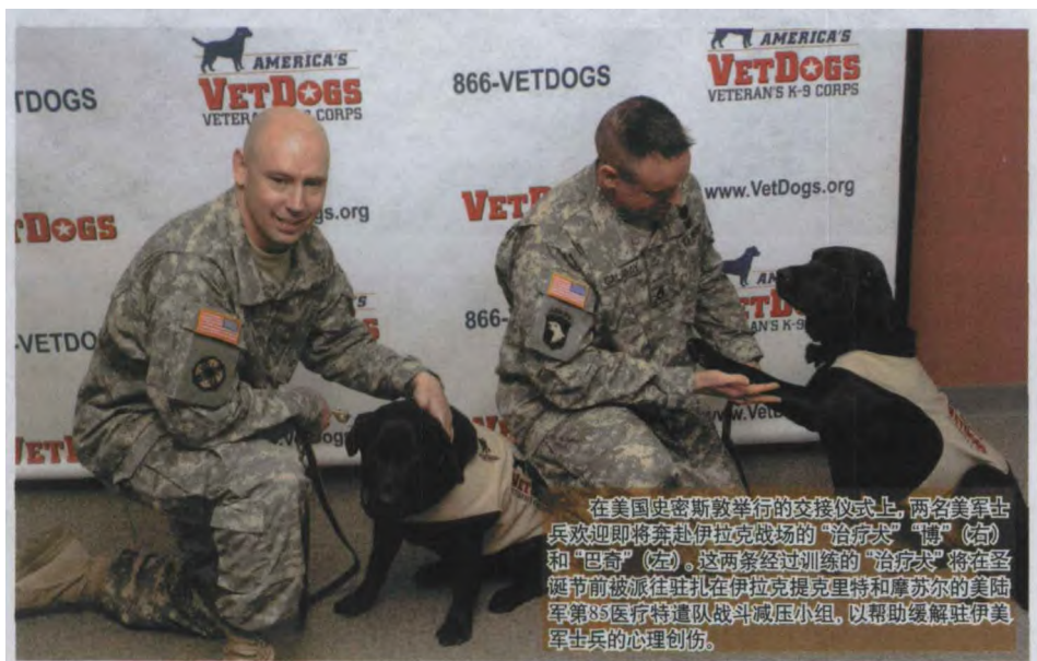
在美国史密斯敦举行的交接仪式上，两名美军士兵欢迎即将奔赴伊拉克战场的“治疗犬”“博”（右）和“巴奇”（左）。这两条经过训练的“治疗犬”将在圣诞节前被派往驻扎在伊拉克提克里特和摩苏尔的美陆军第85医疗特遣队战斗减压小组，以帮助缓解驻伊美军士兵的心理创伤。

对于老兵从海外前线归来之后屡屡杀人，有报道称其实质是“战争综合症”在作祟，而与10多年前的海湾战争造成的综合症不同的是，“伊拉克或阿富汗战争综合症”的最明显体现就在于这些经历了生死存亡考