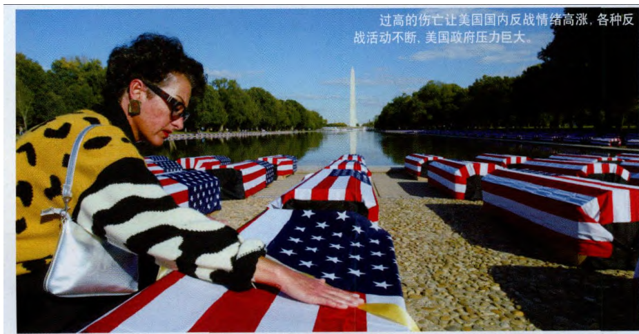
过高的伤亡让美国国内反战情绪高涨,各种反战活动不断,美国政府压力巨大。