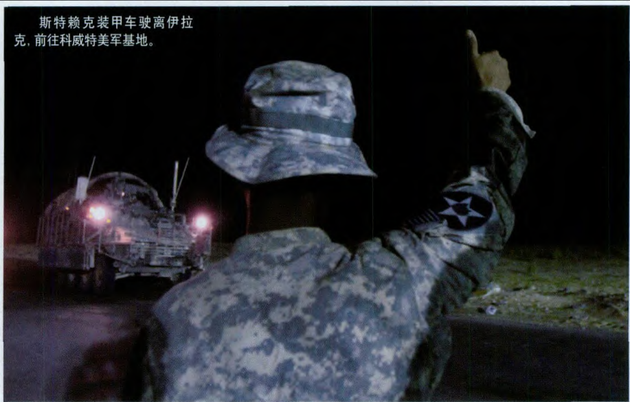
斯特赖克装甲车驶离伊拉克，前往科威特美军基地。

就在美军加紧筹备撤离的同时，伊拉克安全局势急转直下，而伊拉克政府组阁更是持续陷入僵局，局势如何发展，令人关注。因此，伊拉克平民对美军撤出后有