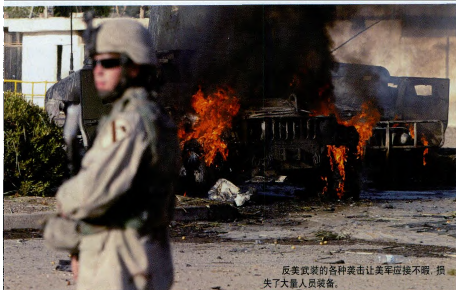
反美武装的各种袭击让美军应接不暇，损失了大量人员装备。

派阿富汗的部队已基本到位，我们将与阿富汗和国际盟友一起，向塔利班发起进攻；在民事方面，我们坚持要求更多问责制，阿富汗政府已采取切实措施促进发展、打击腐败；推出了一项整合计划，允许阿富汗武装人员放下武器。”