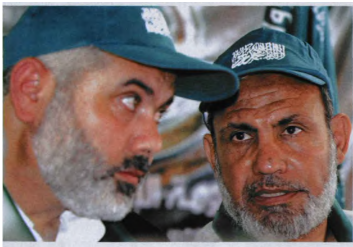
哈马斯两巨头——总理哈尼亚(左)与外长扎哈尔