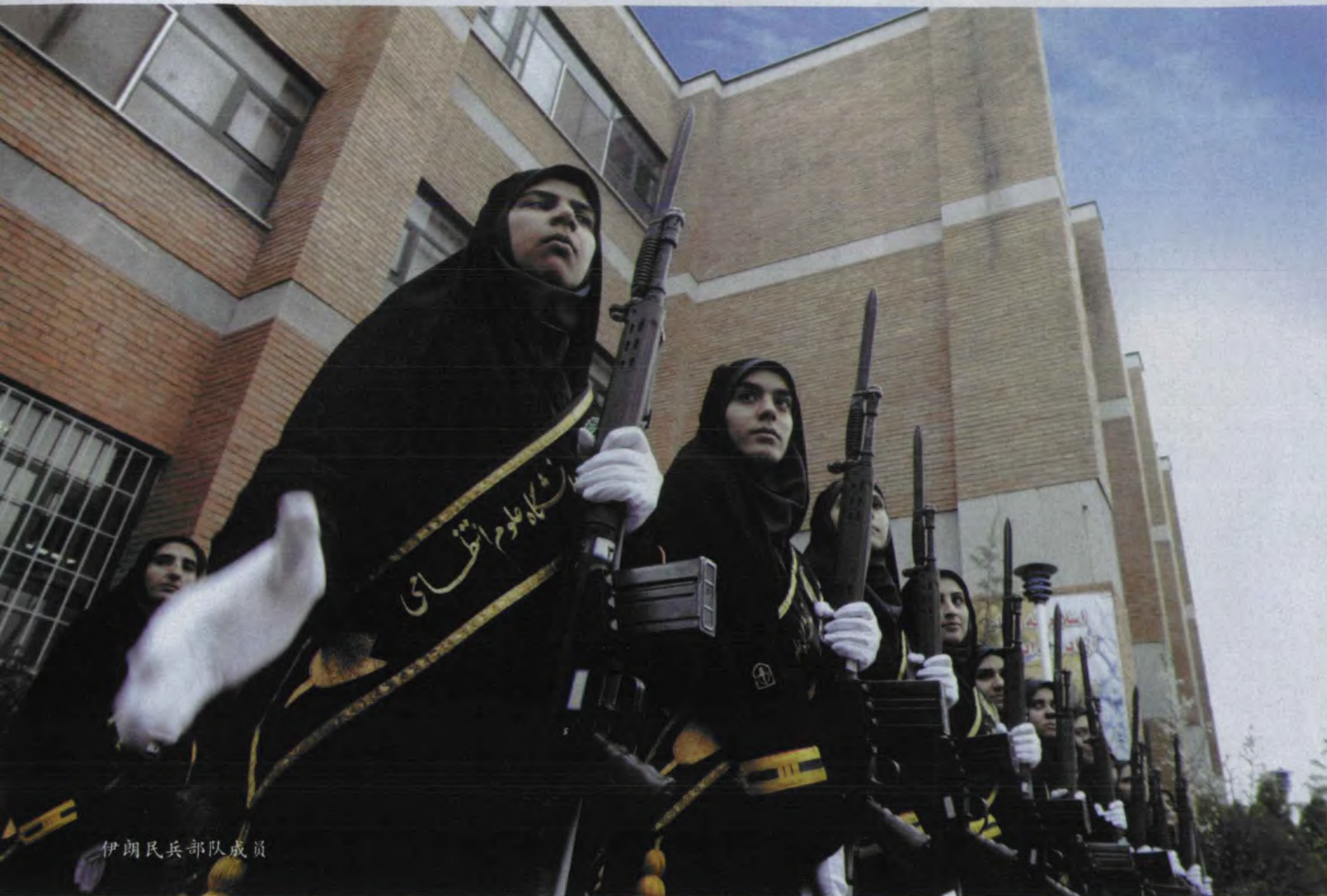
伊朗民兵部队成员