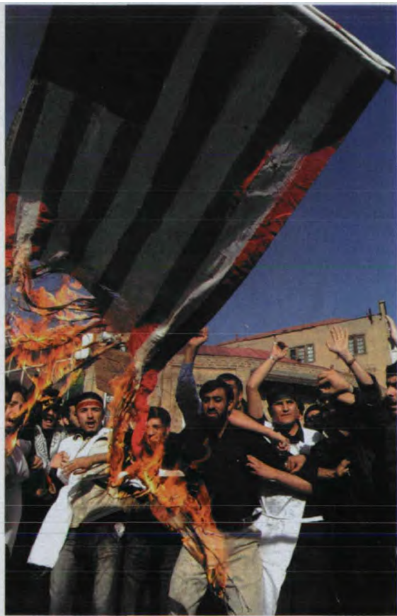
伊朗民众焚烧美国国旗

当选总统后，内贾德申报的财产清单更是震惊了全世界：一套住了40年、连沙发都没有的老房子，一辆近30年、连空调都没有的老爷车，两部电话，两张数字为零的活期存折——这就是他的全部家当！但他却说：“我的资产奇大无比，那就是我为人民服务的高度热情，其他均无可比拟。”他还多次强调：“我为成为伊朗国家的仆人和大街清扫员而感到骄傲。”