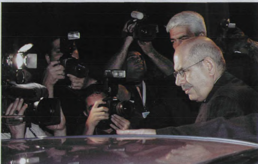
4月13日凌晨，巴拉迪抵达伊朗，吸引不少记者

从伊拉克到朝鲜，再到伊朗，核危机一次次考验着巴拉迪。这位1997年上任的总干事，为什么能处变不惊，稳任其职？他的能量从哪里来？本刊记者为此专程来到他在埃及的老家，并访问了与他共事十年有余的中国同事。