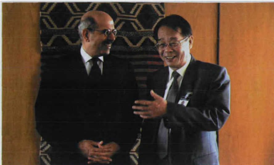
巴拉迪与国际原子能机构前副总干事钱积惠

当然，1997年巴拉迪升任总干事之后，就不再轻易离开自己的办公室。连副总干事要见他都要通过他的助手安排时间，而且一般不超过半个小时。并不是他一当官就端架子，而是因为事情实在太多。国际原子能机构有139个成员国，巴拉迪必须协调好各成员国的利益。作为2000多雇员的当家人，巴拉迪有一个基本的职责，就是要向世界证明，国际原子能机构的存在是必要的。只有这样，它才能获得足够的经费运转