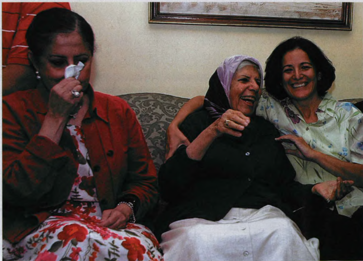
2005年10月7日，巴拉迪的母亲（中）、妻子（左）和女儿（右）得到他获得诺贝尔和平奖的喜讯

2005年10月11日，一封写给巴拉迪的信从中国四川成都发了出去。信中祝贺巴拉迪和国际原子能机构荣获诺