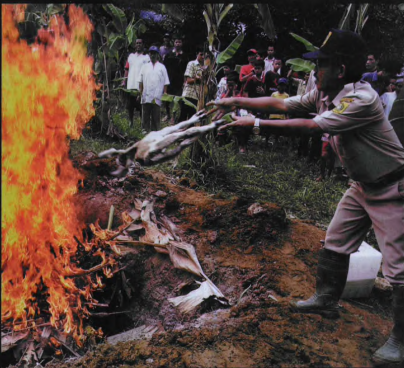
2004年10月，炭疽病菌引发6人死亡，印尼政府高度紧张，随即封锁了病发村庄，并焚烧了一切可能被炭疽病菌感染的动物及物品