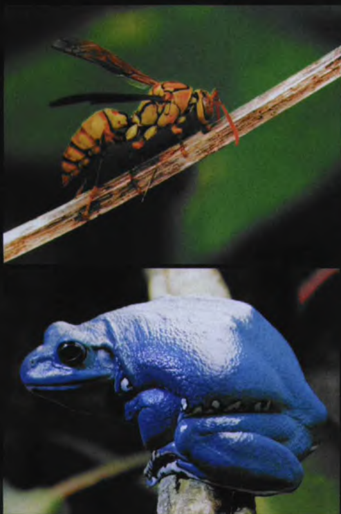
如果将南美杀人蜂的残忍基因和澳洲杀人螞蜂的剧毒基因移植到普通蜜蜂或青蛙身上，它们将变成可怕的“动物兵”