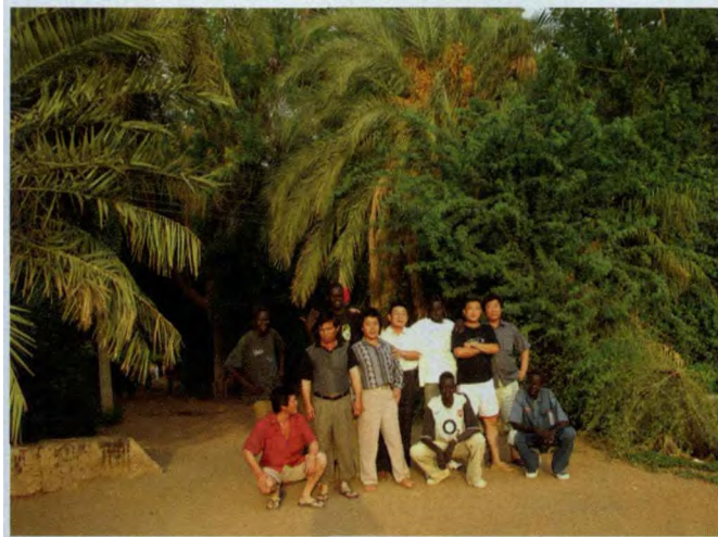
■作者与石油工人在一起

是绝对禁止的，私自饮酒，一旦被发现不但要没收酒，有的还要酌情对饮酒人进行罚款或者拘留。