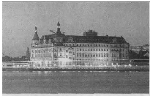
哈伊达尔帕夏清真寺