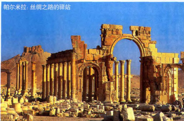
帕尔米拉：丝绸之路的驿站

实际上，在阿拉伯女人地位非常高。肖克说阿拉伯男人一辈子第一个任务就是：保护女人。女人对他们来说就是珠宝，他的母亲，他的姐妹，他的爱人，代表他的尊严，他可以为她们卖命。如果是当地男人对陌生女人随便拍照，那就不用活了，只要女人一喊，什么都不用问，那个冒犯的男人就一定会挨打。但如果外国人对陌生的女人拍照，可能不会挨打，但这真的是很不礼貌的。