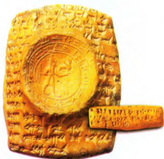
叙利亚发现的最早的字母

亚的历史悠久，基督教在这里起源，这里的古罗马文化甚至比罗马更多。这里名副其实是一个完整的博物馆，无论你到何处都会发现值得参观的古迹。同时这里还是中国古丝绸之路的另一端，在这个地方有很多古代的建筑，它们的记载历史有12000多年。叙利亚的诸多古城和古代王国，都在向人们讲述着当时的历史，当时的叙利亚文明。