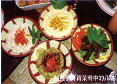
阿拉伯胃菜肴中的几种