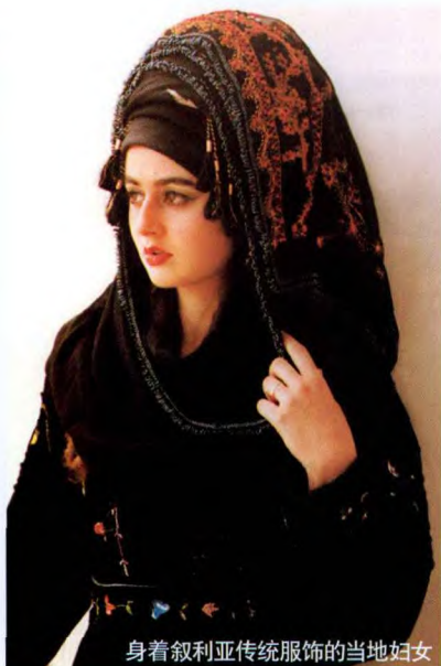
身着叙利亚传统服饰的当地妇女