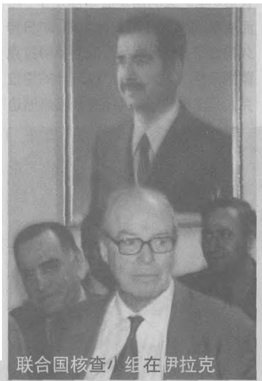
联合国核查小组在伊拉克

战争的泥潭，并使整个民族和国家为此付出了沉重的代价，但他也不像有些西方媒体所描绘的那样，是个“战争恶魔”。他具有不同寻常的政治手腕和独特的个人风格。