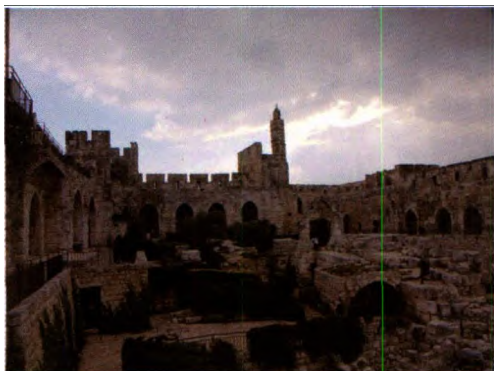
大卫城塔(亦称大卫塔,tower of david)是耶路撒冷旧城的最高处,两千多年前由希律特王建造的城塔,现在保存着三座城塔,以及罗马、拜占庭、十字军和土耳其时代的建筑遗迹