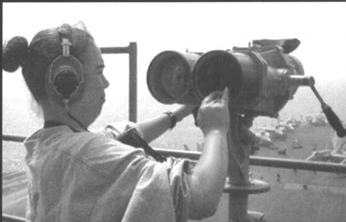
▲ 战争，女人也无法离开 “企业号” 航母上的女兵在检修望远镜

◀ 美国“企业”号核动力航空母舰为世界上第一艘核动力航空母舰。航母上有舰员 3215 名，其中军官 171 名；航空人员 2480 名，其中军官 358 名；旗舰人员 70 名，其中军官 25 名。航母上有 3 座 8 联装“海麻雀”舰对空导弹发射装置；3 座 MK 15 密集阵；4 座 MK 36-S-RBOC，4 座 C13-1 型弹射器。“企业”号上一般配备 20 架 F-14“雄猫”，36 架 F/A-18“大黄蜂”，4 架 EA-6B“徘徊者”，4 架 E-2C“鹰眼”，6 架 S-3B“北欧海盗”，2 架 ES-3A，4 架 SH-60F 和 2 架 HH-60H“海鹰”直升机