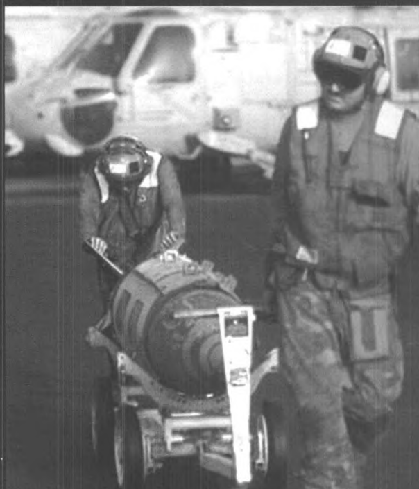
美军为“企业”号航母上的F-14 战斗机装载军火

▲ F-14 战斗机是美国格鲁门公司 1970 年研制的。最大时速 2486 千米，实用升限 18200 米，作战半径 725 千米，最大起飞重量 31101 千克。机上装备 1 门 6 管 20 毫米航炮，10 个外挂点可挂 6 枚空对空导弹，对地攻击时最大载弹量 6577 千克。机上还装有多普勒火控雷达、惯性导航系统及电子对抗设备，是美国海军的主力重型舰载战斗机，主要用于舰队防空和对地攻击。