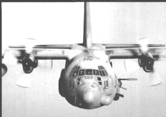
AC-130“空中幽灵”作战飞机

▶ 美军在10月16日对塔利班的军事打击中首次使用了AC-130“武装飞船”。AC-130“武装飞船”是美国空军破坏力最强的飞机，杀伤力巨大无比。它是美国在C-130运输机上发展起来的一种专用特种作战飞机。它即可为特种作战部队提供火力支援，也可独立作战，对敌人后方目标实施攻击。它装有一门25毫米“格林”机关枪，一门40毫米“博福斯”式自动炮（每分钟射速为200发）和一门105毫米榴弹炮，有世界上最复杂的飞机武器控制系统