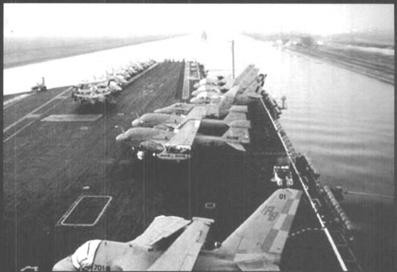
▲ 美国“罗斯福”号核动力航母开赴阿拉伯海

▲ 在美国轰炸阿富汗的军事行动中，特种部队将担当重要角色，特种部队士兵所携带的主要装备包括拜里特狙击步枪、全球定位系统、通讯器材、背包、M203榴弹发射器、护身装甲服、“克雷莫尔”特种炸药、轻便手枪、M15白磷手榴弹、M249轻机枪、夜视镜