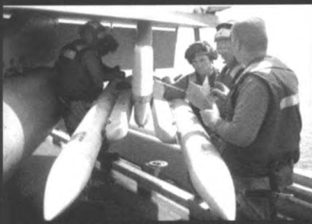
“卡尔·文森”号航母的士兵为战机装载导弹