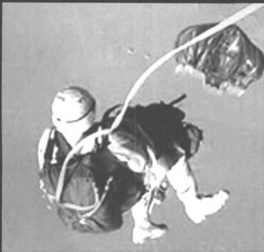
▲ 美国特种兵抵阿富汗，军事打击进入地面战争阶段

▲ 在美国轰炸阿富汗的军事行动中，特种部队将担当重要角色，特种部队士兵所携带的主要装备包括拜里特狙击步枪、全球定位系统、通讯器材、背包、M203榴弹发射器、护身装甲服、“克雷莫尔”特种炸药、轻便手枪、M15白磷手榴弹、M249轻机枪、夜视镜