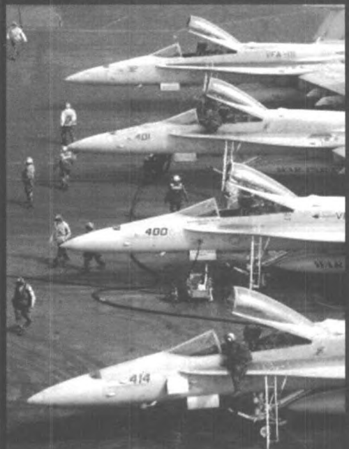
▲ 战机在航母上待命

▲ “卡尔·文森”号航母属于核动力航母，造价为20多亿美元，全长330米，满载排水量为9万多吨，航速为33节，1982年3月13日服役。美国海军对航母上官兵的生活也相当重视，航母上配备了250部电话、300台电视机，每日可以供应1.86万份各式餐点