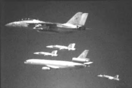
美军战斗机在空中做集体加油