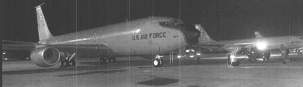
▼ 美军两架空中加油机正准备起飞执行任务