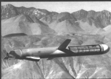
美军发射的巡航导弹飞向目标