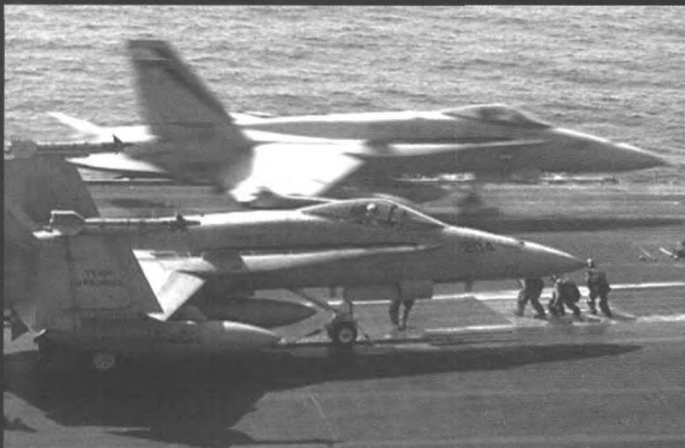
▼ 航母上的引航员在指挥“猎兔狗”战斗机降落

▼ F/A-18 是一种超音速的多用途战斗/攻击机。主要武器有 1 门 20 毫米机炮，备弹 570 发，共有 9 个外挂架，两个翼尖挂架各可接 1 枚；AIM-9L“响尾蛇”空对空导弹。两个外翼挂架可带空对地或空对空导弹。最新的改型是 F/A-18E/F“超级大黄蜂”。