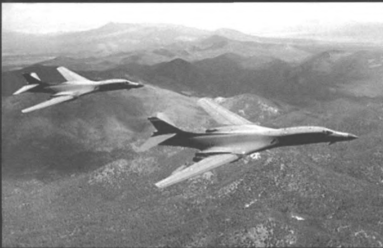
◀ 美国 B-2、B-52 轰炸机飞往阿富汗

◀ B-52 是美国波音公司 1955 年研制的亚音速战略轰炸机。主要用于远程常规轰炸和核突击。机上有驾驶、领航、轰炸、射击及电子等 6 名乘员，最大时速 960 千米，升限 16700 米，最大航程 12000 千米。主要武器有 20 枚近程攻击导弹、4 挺 12.7 毫米机枪及各种炸弹，最大载弹量 20000 千克