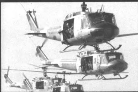
美国动用“阿帕奇”武装直升飞机