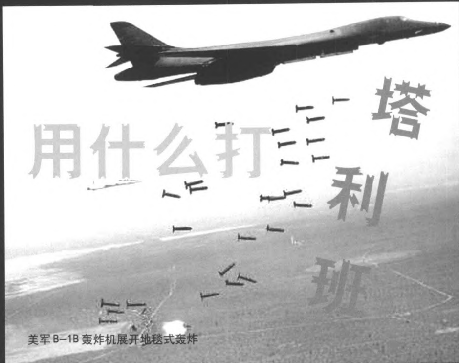
美军B-1B轰炸机展开地毯式轰炸

美国这次是真火了。世贸大楼的断壁残垣依旧高耸，生化武器的威胁又席卷全国。为了出这口恶气，面对装备如同老牛破车的阿富汗塔利班政权，美国动用了先进的武器装备，发誓一定要活捉本·拉登，掀翻塔利班。可以说，美国这次是真要操着牛刀杀鸡了。像阿富汗这样的国家本来就已经非常贫穷，根本没有值得轰炸的目标。但是在荒凉的阿富汗国土的上空，美国已经连续轰炸了十几天，不仅平了塔利班的一些重要设施，还误炸了国际机构的建筑，闹得全世界沸沸扬扬。我们可以看看这次美国祭出的法宝——