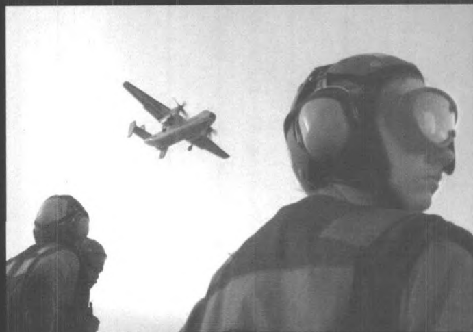
▲ E-2 C 鹰眼侦察机出动

▲“小鹰”号航母主机采用 4 台蒸汽轮机，280000 马力，4 轴推进，航速 32 节。舰员 2930 名，航空人员 2480 名。主要武器包括 3 座“海麻雀”导弹装置，3 座 6 管 20 毫米炮，F-14 战斗机和 F/A-18 战斗机各 20 架，14 架 A-6E 攻击机，E-2C 预警机和 EA-6B 电子干扰机各 4 架，10 架 S-3A/B 反潜机和 6 架直升机