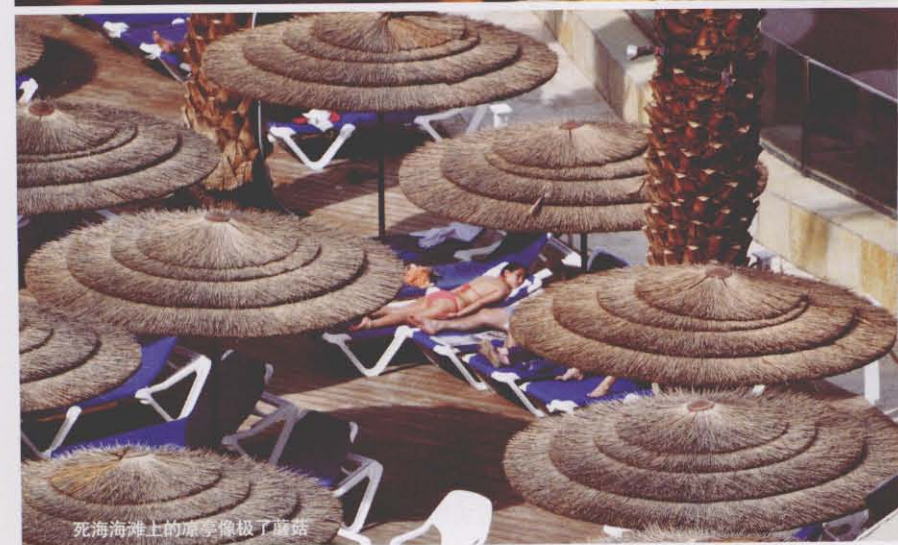
死海海滩上的凉亭像极了蘑菇