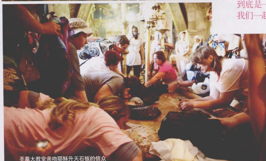
圣墓大教堂亲吻耶稣升天石板的信众