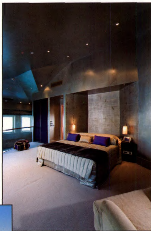
上图: The Sofa Hotel 舒适的标准间卧室; 下图: 在海边享用晚餐和马尔马拉海风的轻拂。来上一杯土耳其国饮raki葡萄酒,再饕餮生猛海鲜。