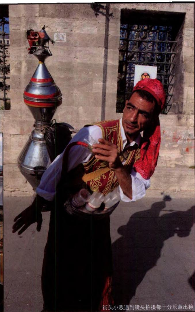
街头小贩遇到镜头拍摄都十分乐意出镜

相映成趣。1935年，这里正式成为一座博物馆。走进大厅的那一刻，就连我们这些看惯了欧洲名教堂的人也凝神屏气。宫廷史官普洛柯比乌斯写道：“当你走进这幢建筑物去祈祷时，你会觉得这项工程不是人力造成的……你会相信上帝也喜欢这个不同寻常的家。”或许他是的。仰头向挑高的大厅顶部望去，头晕目眩，恐怕也只有上帝他老人家才住得惯。据说这种设计是为了宗教仪式的需要，引起人们对空间的无限幻觉。大厅四周有许多带彩色玻璃的拱型窗户，但由于大厅极其宏伟，自然采光的亮度与其面积不成比例，看上去十分阴森，加之几千年浓郁的宗教氛围，让人有种莫名的压力和恐惧。