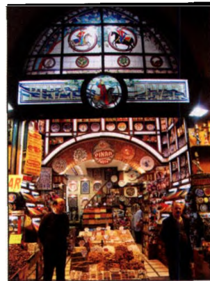
清真寺门口的杂货铺

蓝色清真寺背后的小街巷是真正懂得伊斯坦布尔乐趣的“慢速”游客的秘密去处。这里没有团队游客，没有拥挤的大巴车，干净整洁的纪念品街巷里，大家都不忙着做生意，喝茶的喝茶，下棋的下棋，一群小伙子在空地上演练着街舞的难度动作，看见我们摄影师的镜头便更加卖力，时不时还向镜头挥手喊句“你好！”